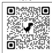
takibi connect 恵庭QR

https://www.takibi-connect.jp/town/eniwa