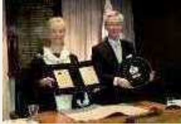
2008年(平成20年) ティマル市と姉妹都市締結調印式