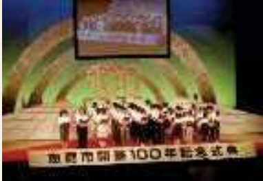
1997年(平成9年) 開基100年記念式典