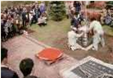
1997年(平成9年) タイムカプセル収納式