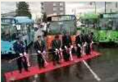
2002年(平成14年) エコバス運行開始