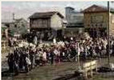
1970年(昭和45年) 市制施行パレード