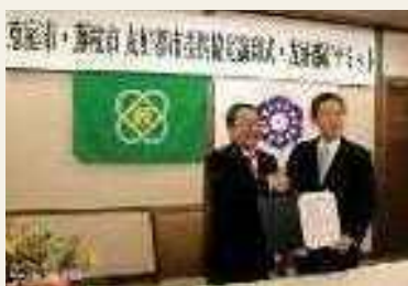
2016年(平成28年) 藤枝市と友好都市提携協定締結