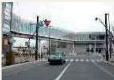
2015年(平成27年) JR恵庭駅西口空中歩廊完成