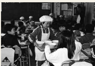
1989年(平成元年) 小学校の学校給食開始