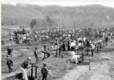
1982年(昭和57年) 桜公園植樹