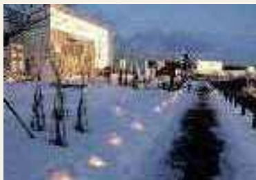
2015年(平成27年) フレスポ恵み野オープン