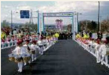
1992年(平成4年) 恵庭バイパス恵み野こ線橋開通