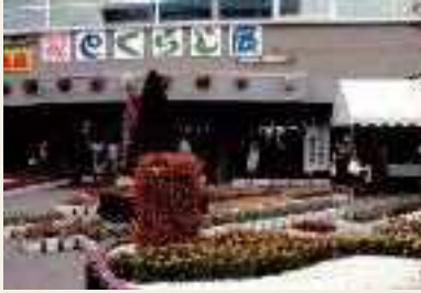
1990年(平成2年) 第1回恵庭花とくらし展開催