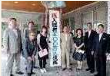
2010年(平成22年) 図書館来館者500万人達成