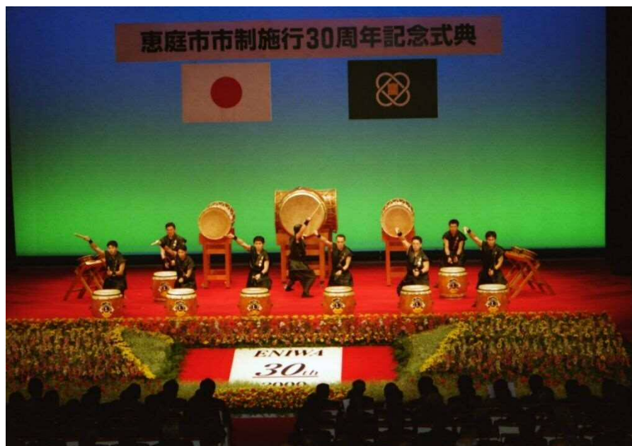
<平成12年11月1日 市制施行30周年記念式典>