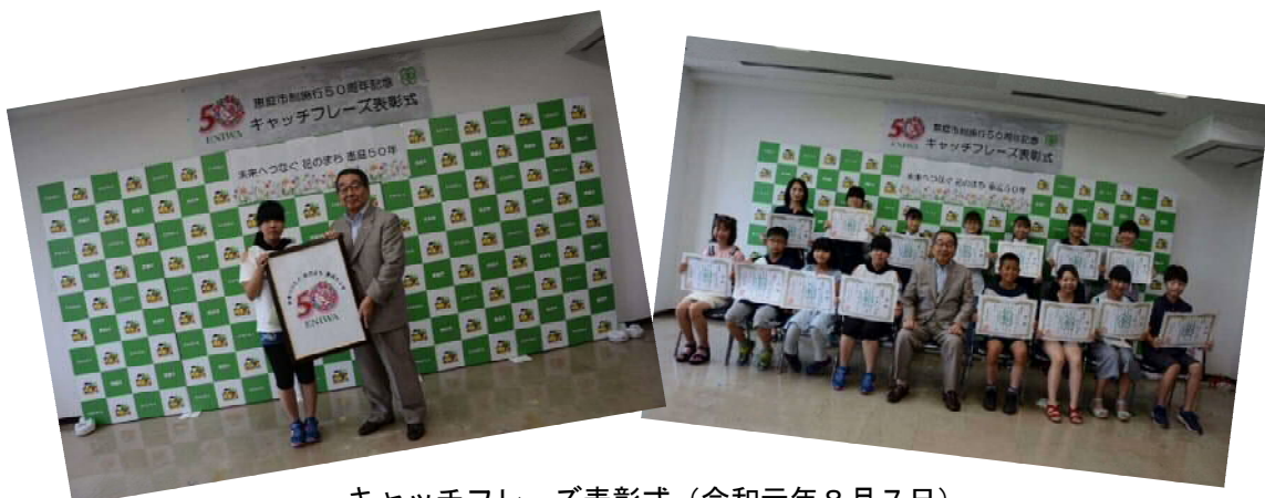
キャッチフレーズ表彰式（令和元年8月7日）

庁内プロジェクトチーム ⇒ 68作品に絞り込み 市民プロジェクトチーム ⇒ 34作品に絞り込み 推進委員会 ⇒ 18作品に絞り込み 実行委員会 ⇒ 1点を最優秀作品、17作品を優秀賞作品として選出