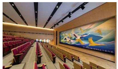
北海道文教大学 鶴岡記念講堂大ホール