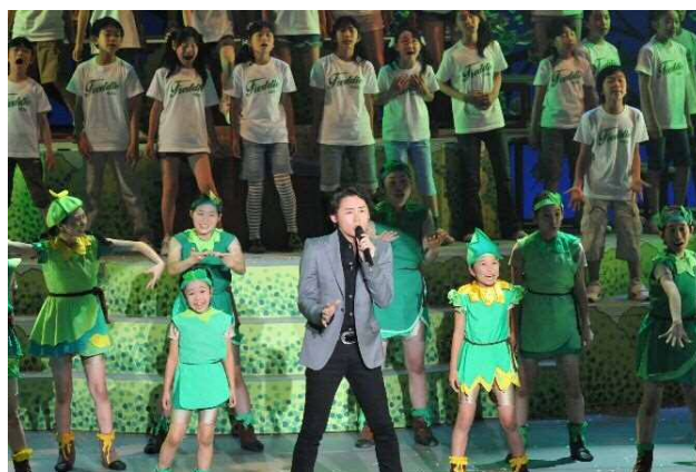
・北海道洞爺湖サミット応援企画の一環としてミュージカル「葉っぱのフレディ〜いのちの旅〜」開催(7月8日)