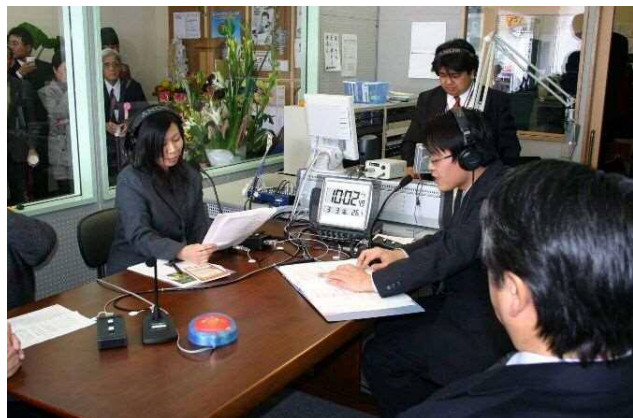
• 地域 FM「FM パンプキン」本放送開始(3月3日)