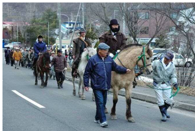
• 「クラーク博士さよなら130年フェスタ」開催(4月16日)