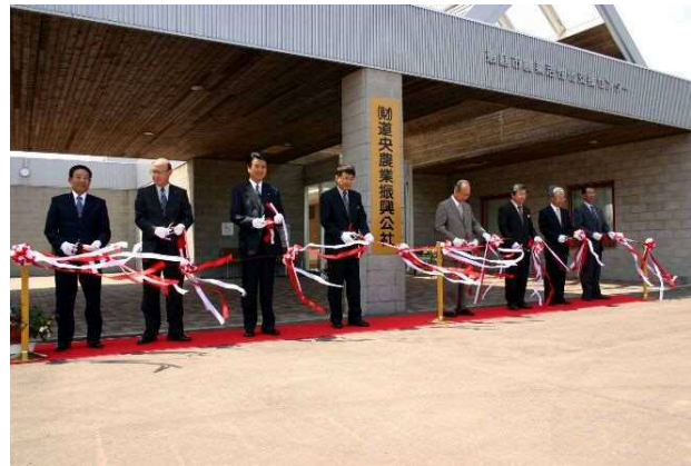
・ 広域農業振興公社「道央農業振興公社」の発足(6月2日)