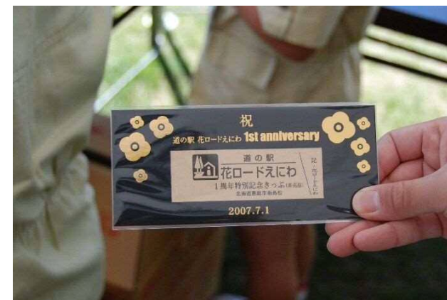
• 道と川の駅「花ロードえにわ」が開設1周年(7月1日)