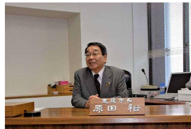
• 市長選挙、原田裕市長誕生(11月15日)