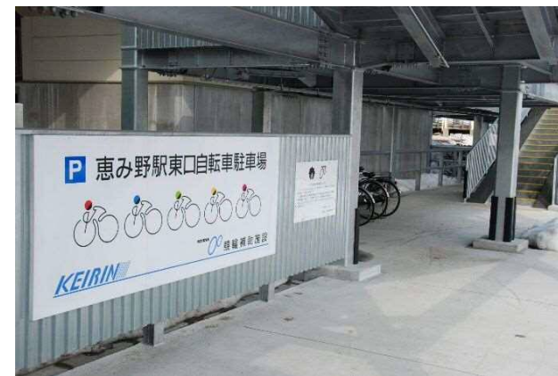
・JR 恵み野駅東口に738台収納可能な自転車駐輪場オープン(4月4日)