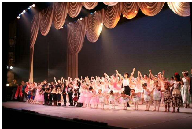
• 恵庭市文化協会主催「第1回ジュニアアートフェスティバル in えにわ」開催(1月17日)