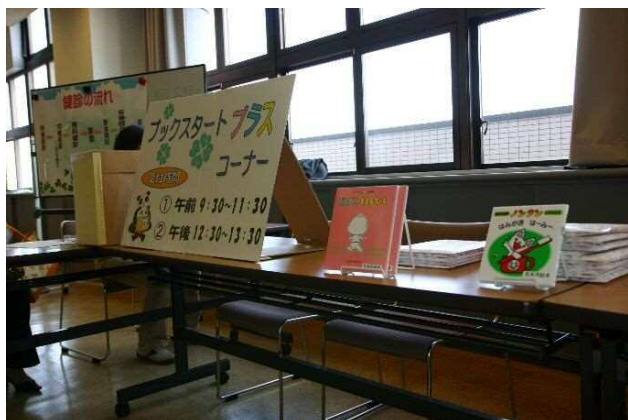
• 「ブックスタートプラス」開始(4月6日)