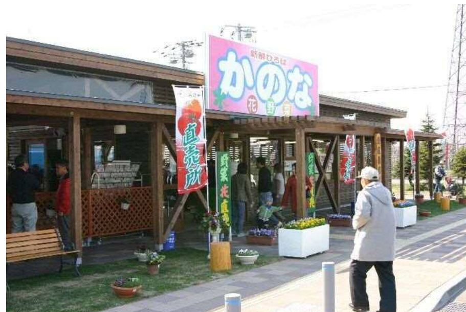
• 農畜産物直売所「花野菜(かのな)」オープン(4月28日)