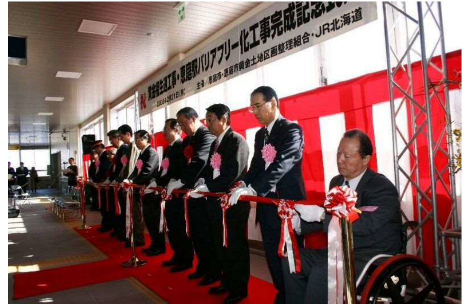
・ JR 恵庭駅バリアフリー工事完成記念セレモニー開催(2月21日)