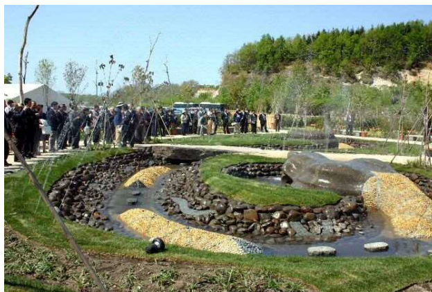
• テーマパーク「えこりん村」がグランドオープン(6月1日)