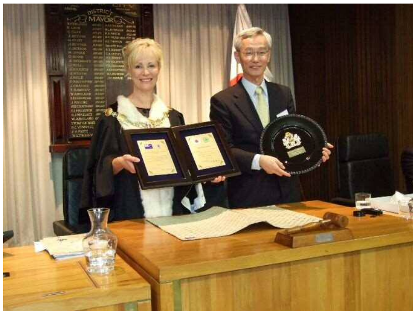
・ニュージーランド・ティマル市で国際姉妹都市締結調印 (2月13日)