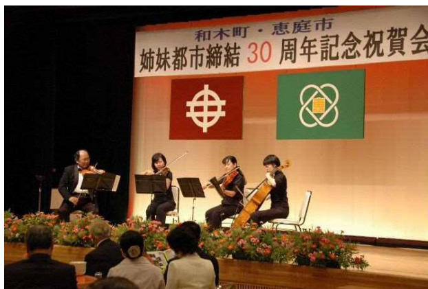
• 山口県和木町と恵庭市の「姉妹都市締結30周年記念祝賀会」開催(6月27日)