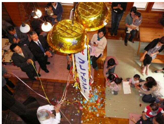
・「恵庭市プレイセンター」が恵み野にオープン (9月25日)