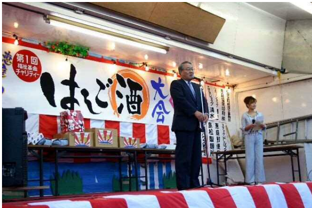
・ 第1回恵庭はしご酒大会開催(7月27日)