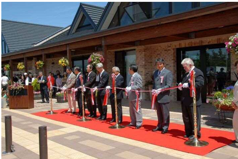
• 道と川の駅「花ロードえにわ」オープン(7月1日)