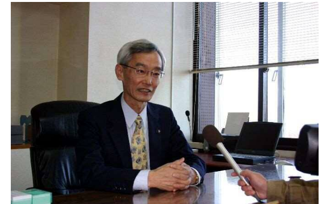
・ 市長選挙、中島興世市長誕生(11月13日)