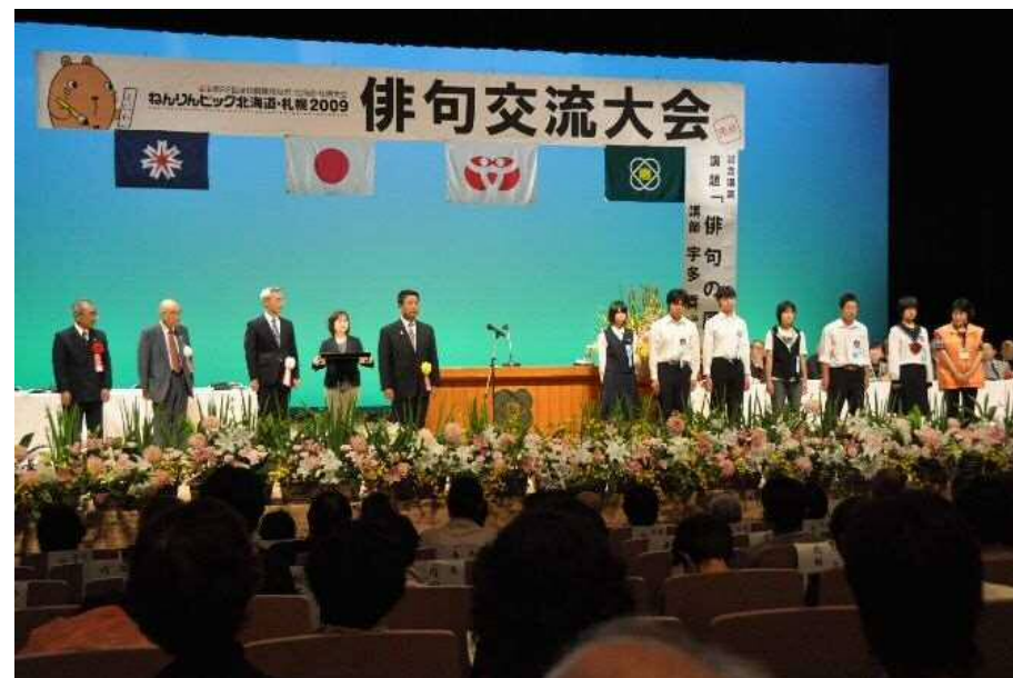
• 「ねんりんピック北海道・札幌2009」開催(9月6日)