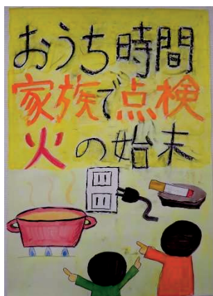
久保田 翔太さんの作品