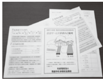
高齢者等除雪サービス事業のチラシ等

ら対応できるという方も居られるかも知れません。その様な方々にも、対応できる様な事も必要だと思えますが、所見を伺います。