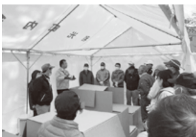
和光町内会自主防災組織の防災訓練の様子

二つ目の倉庫や備品が買えないといったこともあります。防災倉庫は、公園内に設置して緊急時に速やかに使える様にといい要望も寄せられています。こういった地域のニーズがありますが所見を伺います。