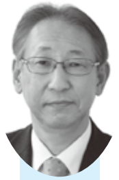
公明党 野沢宏紀 議員