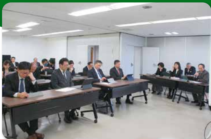
第2回恵庭市議会ハラスメント防止に向けた研修会 (11月24日)