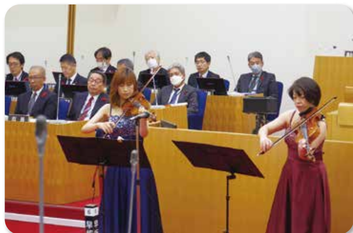
恵庭市議会 議場コンサート (12月4日)