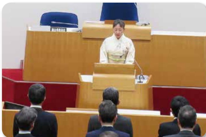
令和6年 仕事始めの会 議長挨拶 (1月4日)