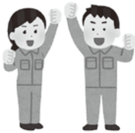
中小企業で働く人達のイメージイラスト

国の制度として、小規模事業者の持続化補助金があります。札幌連携中枢都市圏でも、新製品や新技術の開発のための支援、また販路拡大に向けた支援や人材不足に向けた支援が行われています。また、道央産業振興財団でも、製品開発支援事業が実施をされています。更には、恵庭市農商工等連携推進ネットワークによる商品開発に関する様々な支援制度についても情報提供や事業者紹介等を行っており、商品開発の支援、セミナー勉強会等を開催しています。 以上の理由から、市独自の補助制度は、現段階で直ちには創設することは、難しいと考えています。 今後、これらの取組の周知等を行うとともに、地元企業の支援を継続して参りたいと考えています。