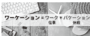
ワーケーションイメージ写真

おり、市内に拠点があり、市外に本社等がある企業の職員研修の誘致等にも取り組んで参りたいと考えています。