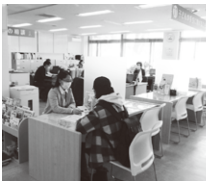
えにわっこ応援センター窓口での相談風景

問 恵庭市教育施設等巡回看護師配置事業の小学校での校外学習等への看護師派遣について課題があると聞いていますが、協議等は進んでいるのか伺います。