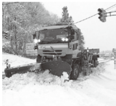
除雪トラックによる除雪作業のイメージ

啓発用のチラシを生活情報紙に折り込んで配布するなど、理解や協力をいただけるよう努めているところです。