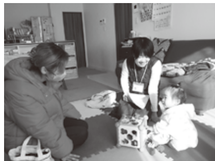
ファミリーサポートセンター事業利用の様子

答 令和5年に運営委託した以前から、現在の料金体系で実施しています。この間、子育て世代のニーズの多様化や社会情勢が変化しています。一方では、利用負担のあり方についての検証も必要だと考えています。