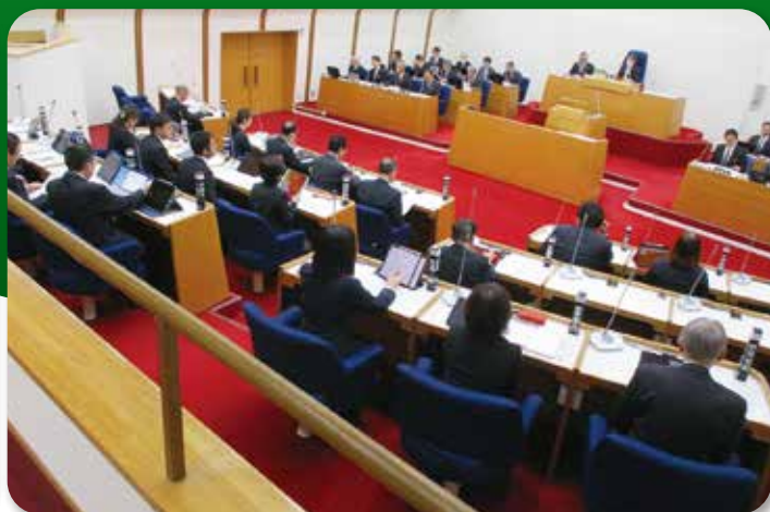
恵庭市議会 第4回定例会 (初日) (11月24日)