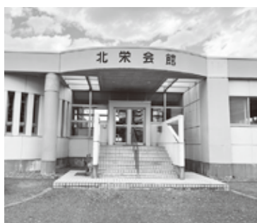
正面から見た北栄会館

問 北栄会館は、周辺住民にとってなくてはならない施設だと思います。本市の施設は老朽化の先に統合などで廃止、撤去になってしまいうことが少なからずあると思います。廃止となってしまうと代替施設が何キ口も離れた施設となり、統合の対象となるため、区域的な施設の在り方とは何を含むのか、伺います。