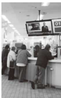
混雑する市民課窓口

にも拡大することを目指し関連する窓口を回ることを減らす「ワンストップサービス」の実施に向けた取組を推進して参ります。