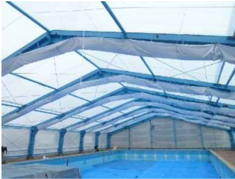
シートを覆い塗装膜落下を防止