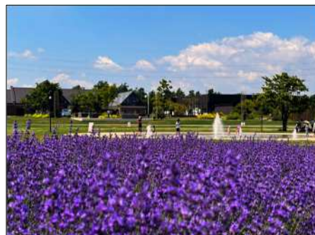
＜ 図1 花の拠点（はなふる） ＞

成果と課題を踏まえ、第3期（令和8年度～令和17年度／2026年度～2035年度）の策定作業を進行中。第2期の成果を活かし、花・自然・スポーツの地域資源を基盤に観光振興をさらに推進する。