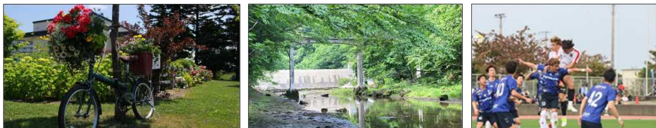
＜ 図2 暮らすように味わう 花／自然／スポーツ ＞