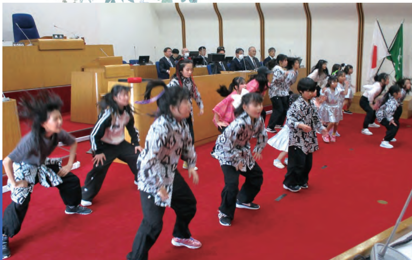
全身で躍動する「Dance Studio Ruminos」の皆さん(令和8年3月24日)

令和8年第1回定例会は、2月19日から3月24日までの34日間の会期で開催されました。