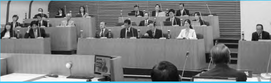
令和8年3月24日(本会議最終日)