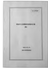
恵庭市立図書館改修基本計画(案)

答 令和8年度は「第6期総合計画」の初年度であり、今後10年間の恵庭のまちづくりがスタートする重要な1年です。近隣では、ラピダス社の量産体制整備やポールパークを核とした周辺整備、GX金融・資産運用特区指定など、様々な動きがみられます。本市においても、こうした新たな動きに対応するための準備を着実に進めており、令和8年度は、これらを含め、これまで私たちがふくらませてきた夢を、希望から現実へ、未来をひらくまちへと