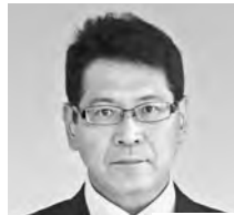
自由民主党 議員 吉永 孝之 たかゆき よしなが