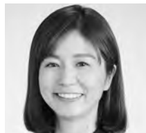
自由民主党 議員 三上 まどか みかみ まどか