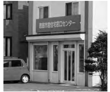
恵庭市営住宅窓口センター