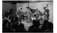
夢創館でのコンサート

展望については、文化芸術の各種情報発信を図っていくとの答弁がありました。 その後、どのような事業が実施されたのか伺います。 答 文化芸術の情報発信については、夢創館の指定管理業務の一つとして、恵庭市文化芸術周知事業を実施しています。 この事業では、ホームペー ジや市内3ヶ所に設置する 予定のデジタルサイネージ で、夢創館以外の場所で行わ れる文化芸術事業について も、情報を収集し、市内イベ ント情報として広く周知し ていくこととしています。 このデジタルサイネージは 恵庭地区、恵み野地区、島松 地区に1ヶ所ずつ設置する 予定で、現在は島松地区の 夢創館に1ヶ所設置してお り、恵庭地区や恵み野地区 に関しては、人が多く集まる 駅などに設置できるよう、調 整を図っているところです。 また夢創館での様々な文 化活動を周知する冊子を、 四半期に一度作成している ほか、SNSなどでコンサート などの動画を掲載するなど、 市内外に本市の文化芸術活 動を周知しているところです。