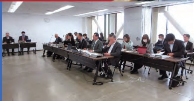
予算審査特別委員会(個別質疑)で審議する各委員(令和8年3月4日)

一般質問では13名の議員が、予算審査特別委員会代表質問では、各会派から4名の委員が、市執行部に対し質問し活発な質疑が行われました。