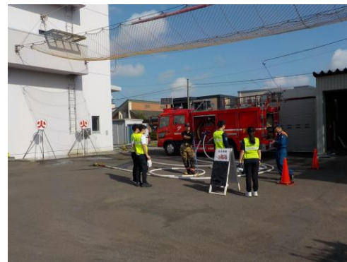
学生サポーターによる支援