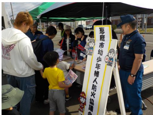
幼少年婦人防火協議会