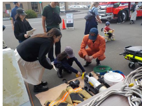
触って遊べる資器材コーナー