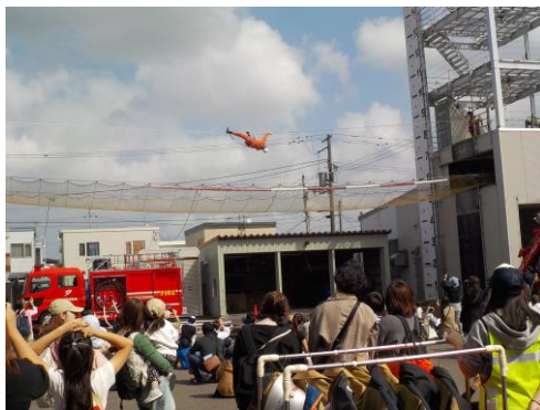
ロープブリッジ渡過訓練展示