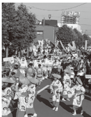
郷土芸能の「恵庭すずらん踊り」

答 恵庭イベント推進委員会を中心に、広報PR活動を行っています。一部の地域では、人手不足等により、イベントの実施が困難との声も寄せられています。こうした、地域が抱える問題や状況を把握し、どのようなことができるか見極めて参ります。