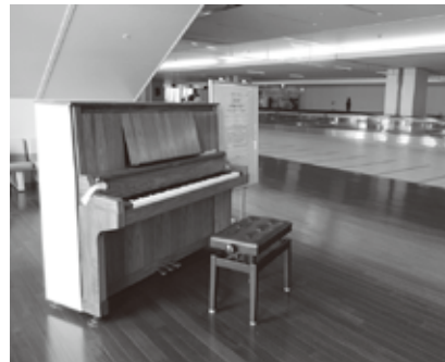
常設のストリートピアノ（新千歳空港）

6月24日から開催する花とくらし展において、晴天時に装飾した電子ピアノを屋外に設置し、ストリートピアノを実施する予定です。