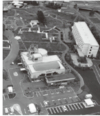
上空からの「はなふる」全景

問 千歳市、北広島市の3市と連携した周遊観光を進めることも、効果的だと思いますが、所見を伺います。