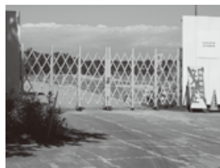
ラピダス社工場建設予定地(千歳市)

答 適切な判断を行うため、正確な情報収集を行った上で、新たな工業団地の造成に関わる可能性調査の実施について、検討して参ります。