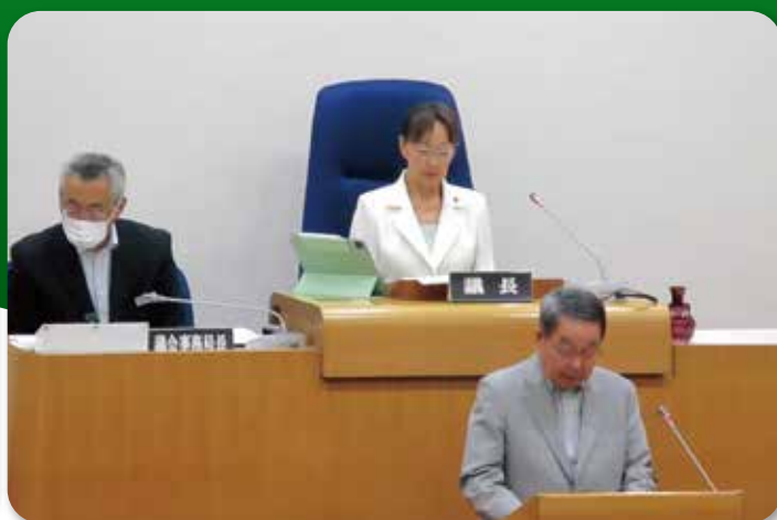
恵庭市議会第2回定例会〔一般質問〕 (6月14日)