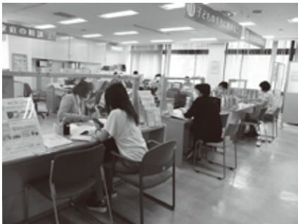
えにわっこ応援センター窓口での相談風景

答 無償化するための財源確保が課題であり、物価高騰が始まった令和4年度からは臨時交付金を活用し、給食費を無償化した事例もありますが、臨時交付金については活用期限が不明であり、市独自で無償化することは非常に困難であると考えております。