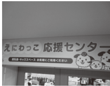
えにわっこ応援センターの入口看板

後、また就職したくてもなかなかできないなど、状況は人によって様々ですが、相談しやすい体制づくりはどういった形で進め、検討されているのか伺います。