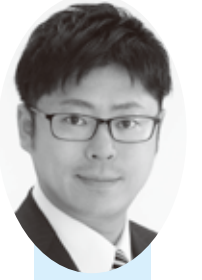
自由民主党北海道