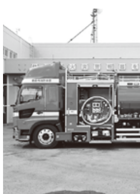
調整交付金で整備した水槽付ポンプ自動車

特定防衛施設周辺整備調整交付金については、事業完了後にその成果を市のHPで公表し市民周知を図り、市広報にも掲載しています。