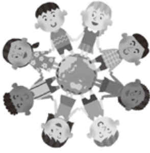
子どもの権利イメージイラスト

答 令和4年10月現在、全国で62の自治体が子どもの権利に関する総合条例を制定しており、道内では6市町が制定しています。近隣では、平成20年に札幌市、平成24年に北広島市が制定しています。