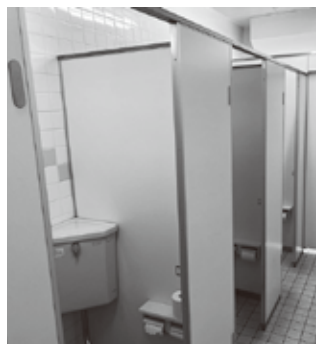
和光小学校のトイレ

答 恵明中学校のトイレの改修を行い、和光小学校は、恵庭中学校の次に実施する予定です。