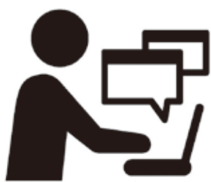
チャットGPTのイメージイラスト

Q&Aが作成され、この生成物を確認することで、Q&Aを完成させるといったことができます。また、職員が作成した文章の要約や校正、催しの開催概要や進行表作成のアドバイス、エクセル関数の作成などの機能を活用することができ、文章の入力に機密情報や個人情報を含めないように注意し、生成物の正確性や妥当性を十分に確認することが必要と考えています。