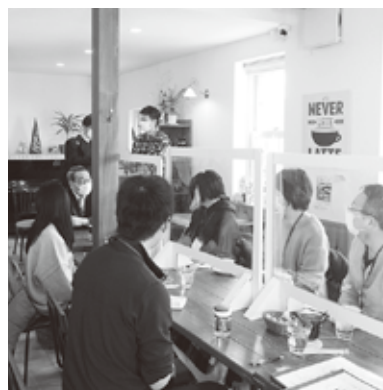
移住者交流会の様子

問 まちづくり基本条例ではコミュニティ形成への積極的な支援が挙げられています。ただ平等ということではなく、公平に後押しをすることが行政の役割ではないか。