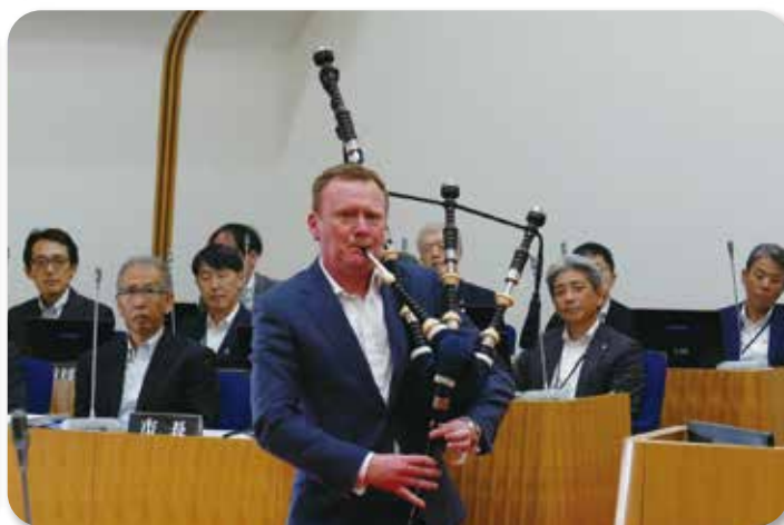
姉妹都市のニュージーランドティマル市副市長の スコット・シャノン氏の『バグパイプ』演奏 (6月27日)