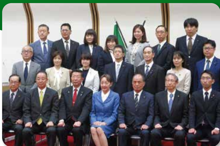
新体制となった恵庭市議会議員 (5月19日)