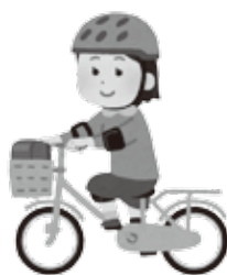
ヘルメット着用児童のイメージイラスト

ヘルメット着用の義務化等、様々な検討が必要と考えておりますので、道内外の様々な事例、先進事例等の調査研究を行って参りたいと考えております。