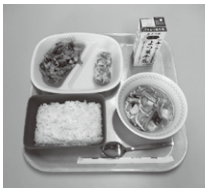
6月23日の中学校給食メニュー