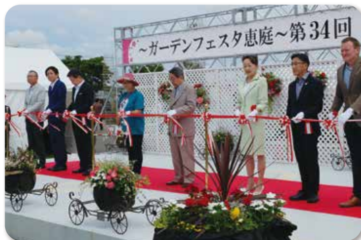
ガーデンフェスタ恵庭～第34回恵庭花とくらし展 オープニングセレモニー (6月24日)