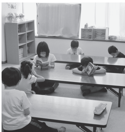
市内の児童クラブ

答 児童クラブについては、必要な職員の配置について検討を行っているところですが、昨今の状況を踏まえ、保育園、認定こども園等での仕組みを参考に、児童クラブでの仕組みについても検討していきたいと考えています。