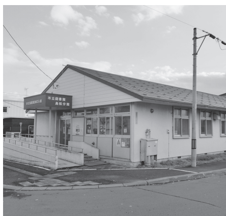
市立図書館島松分館

答 次期都市計画マスタープランにおいても島松地区の取り組みは、引き続き推進して行きたいと考えており、しっかり把握分析するとともに複合化についても老朽化が激しいということから、集約について取り組んで参りたいと思っております。