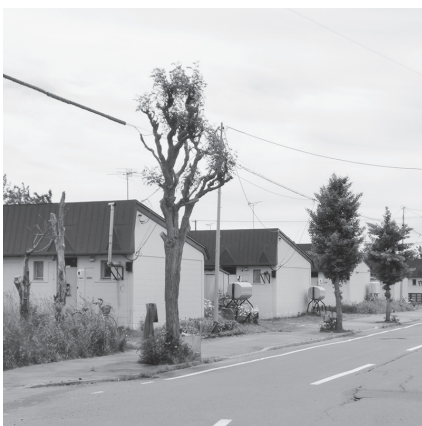
市営住宅（柏陽団地）

答 市としては、この事業を進める上で何とか早期の移転を希望している方に、是非そういったことの起爆剤になるように1棟先行して整備をし、次につなげていきたいと考えています。