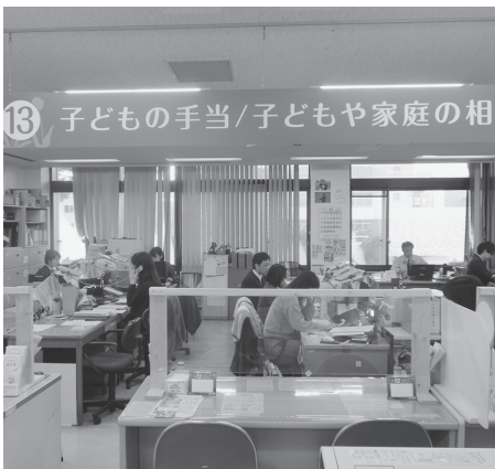
子ども家庭総合支援拠点となる子ども家庭課

問 児童虐待の相談業務や母子保健業務は、マンパワーが必要不可欠であると考えます。このため、現場の職員の負担を増やすのではなく、職員を増員して組織体制を強化すべきと考えますが、ご所見を伺います。