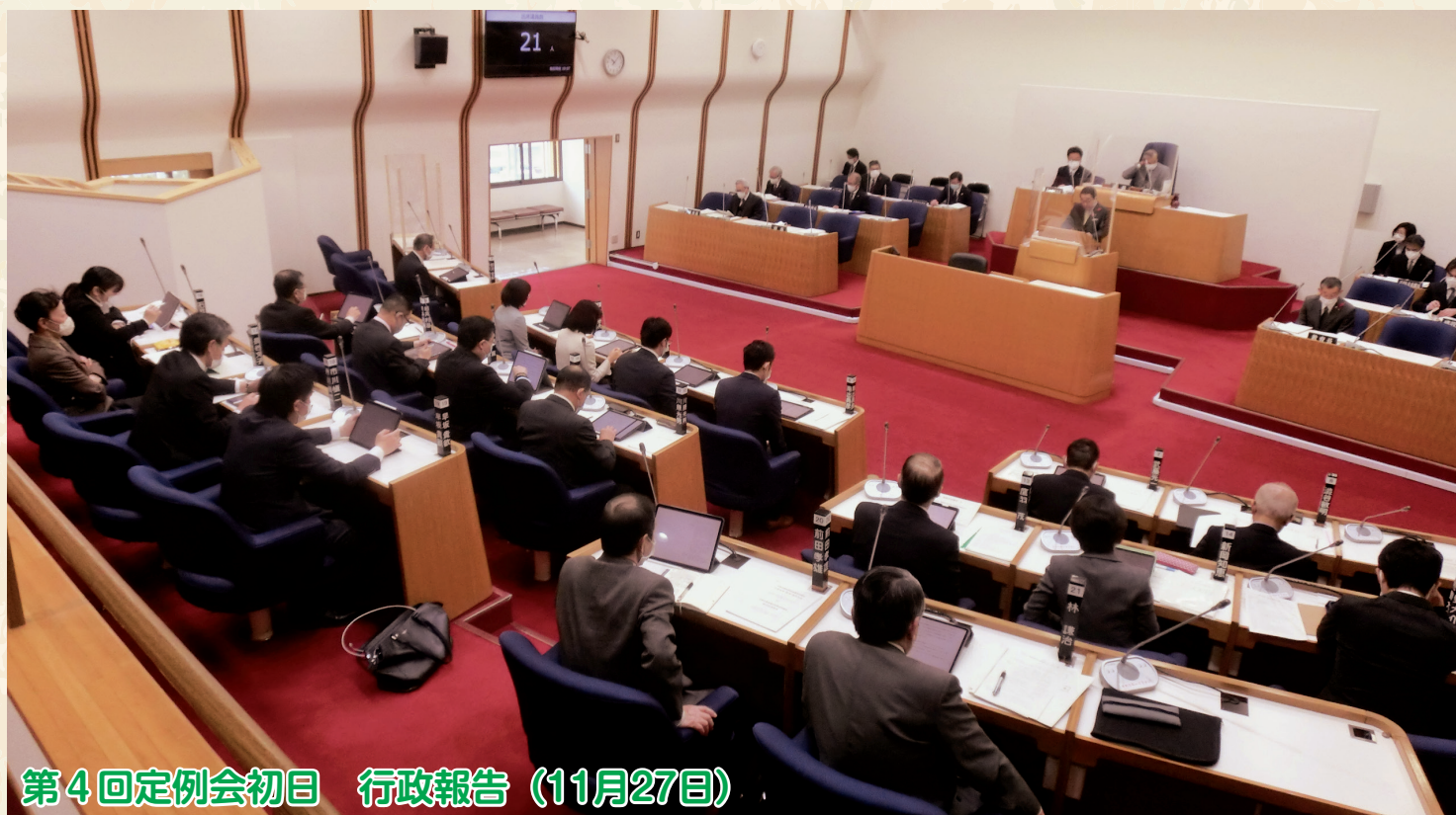
第4回定例会初日 行政報告 (11月27日)