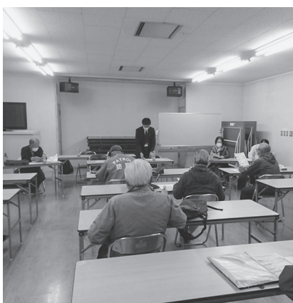
避難行動要支援者制度の町内会説明会

答 いろいろな部署が関係する事業と考えており、庁内での情報共有に加えて、地域とも情報共有を図りながら災害対応に当たっていききたいと考えています。