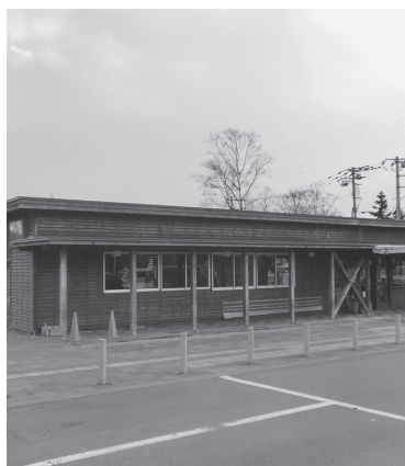
旧農畜産物直売所 (かのな)

答 総括管理運営会社や道と川の駅、農畜産物直売所、センターハウス間の連携強化を図りながら、集客や賑わい創出に取り組むとともに、令和4年度開催の全国都市緑化北海道フェアは、恵庭市を全国・全道に発信する大きなチャンスであることから、こうした機会を契機に更なる誘客につなげたいと考えています。