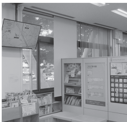
市民ロビーのデジタルサイネージ

今後はサイネージの画面に問合せ先の部局表示や総合案内窓口への誘導表示などにより、市民が必要とする情報資料を入手できるように対応していきたいと考えています。