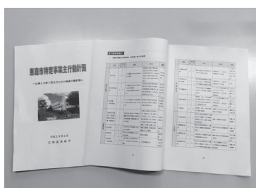
恵庭市特定事業主行動計画

答 政府の目標数値である「30%」や現状の市の取得率などを総合的に勘案し、現状の数値目標である「10%」を上回る新たな数値目標が設定できるよう恵庭市特定事業主行動計画策定委員会において検討して参ります。