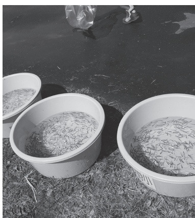
サケの稚魚放流（市内小学校）

答 ふるさと教育の中の環境という部分を強調しながら、各学校で情報共有できるように、そしてお互いに学びあいながら恵庭ならではの環境教育の充実につながるよう進めていきたいと思っています。