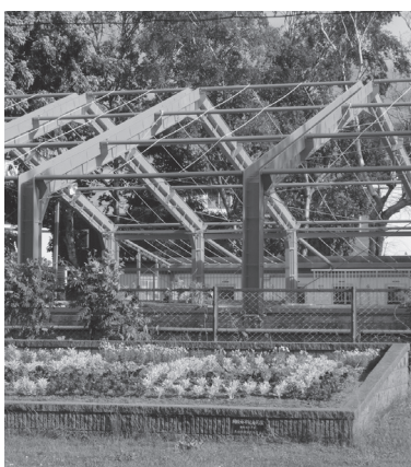
市民プール（恵庭小学校）

答 6月1日から全面解除になって10日程経ち、一定の規制は市民皆さんにお願いしていますが、なお多少の時間をいただき近隣市の動向や国道の考え方などを参考に、市として判断したいと考えていますのでご理解いただきたいと思います。