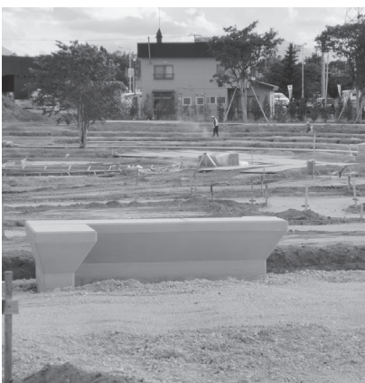
緑化フェアのメイン会場「はなふる」

答 恵庭市には、花のまちづくり活動や「花とくらし展」の歴史が既にあり、緑化フェアの開催は花のまちづくりの一つの集大成として、市内外へ広く発信する場になると考えています。また、メイン会場も市民の憩いの場として長く愛される場所になるものと期待しており、知名度の向上や経済波及効果の拡大などにも期待しているところです。