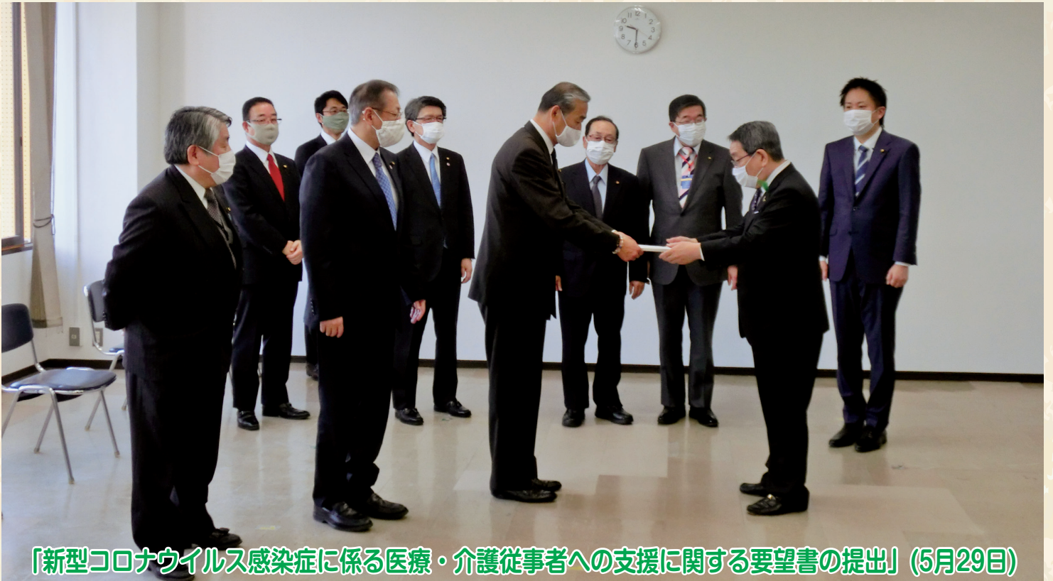
「新型コロナウイルス感染症に係る医療・介護従事者への支援に関する要望書の提出」(5月29日)