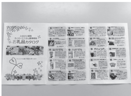
ふるさと納税「お礼品カタログ」

このため、ふるさと納税ポータルサイトの増設時期に間に合うよう調整作業を進めたいと考えています。