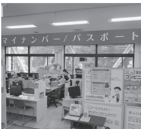
マイナンバーカードの申請窓口（市民課）

答 令和3年3月末から令和5年3月末までに、全ての医療機関に導入を予定しているということです。これによって必要書類の簡略化や、医師による投薬の管理、健康管理等で医療の質が向上すると考えられています。