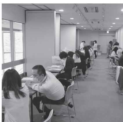
特別定額給付金の審査作業

答 6月8日からは全庁から職員を最大25名動員し、総勢約60名の人員体制で作業を行ったところです。今後も必要な対策を取り、円滑な給付に努めて参りたいと考えます。