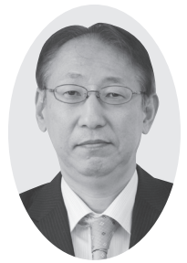
公明党議員団 野沢宏紀 議員