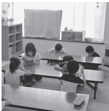
児童クラブ (恵み野旭小学校区)

答 現在36名の待機児童が発生となっており、解消に向けた新たな開設については、設置場所や支援員の確保など、委託法人との協議も必要であり、開設に向けた検討を進めて参りたいと考えています。