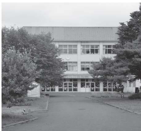
再開した市内小学校（恵庭小学校）

答 学校では手洗いの徹底や健康管理、3つの密を避けるなど感染症の予防とともに、体温や健康状態を確認できなかった児童生徒に対し、非接触型体温計による検温など、健康状態の把握を徹底しています。