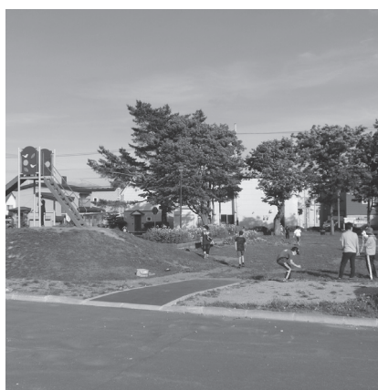
旧市民活動センターに隣接の「すみれ公園」

民間事業者が投資意欲の出るまち、市民が住みやすい、暮らしやすいと感じるようなまちへの方策などを、今後示しながら議論を重ねていきたいと考えています。