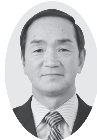
自由民主党 清和会 前 田 孝 雄 議員