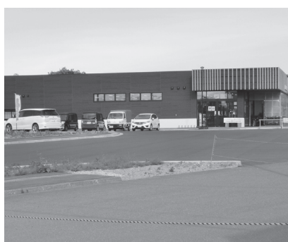
道と川の駅にある直売所「かのな」

答 市民ニーズにしっかり応えるような運行システムを作って行かなければいけないと思っています。しかしながら、一方では一定の費用もかかるわけであり、公共交通の運行については適切に対応して行きたいと思っています。