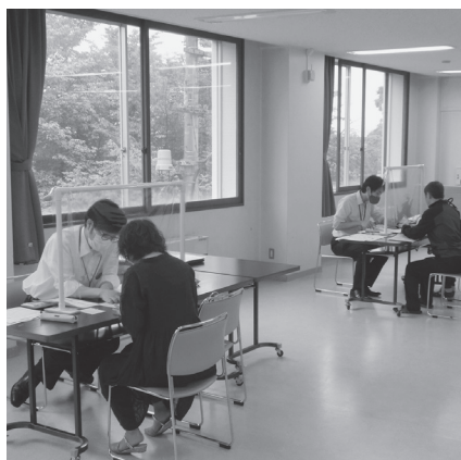
小規模事業者事業継続支援金の申請

答 商品券事業を実施することとしており、まずこの事業を着実に進め、更なる対策の在り方について見極めて参りたいと考えます。