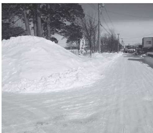
除 雪 後 の 雪 山