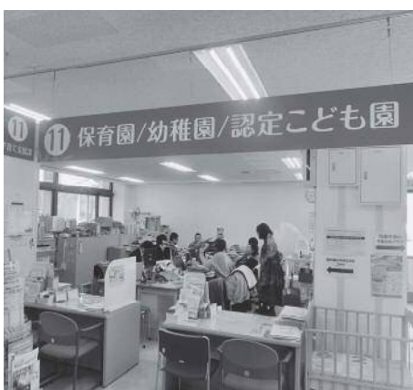
保育園等の担当窓口（子育て支援課）

答 ICT化による保育園職場の環境整備は、導入が軌道に乗れば事務作業が減り、保育支援に専念できる重要な取り組みと捉えております。