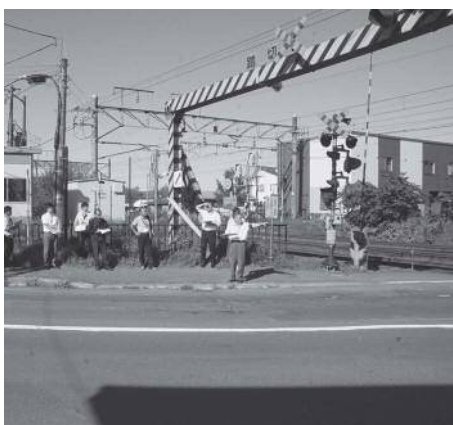
通学路の合同点検

答 不審者の確実な情報については、学校を通して子ども達に周知して行きたいと思いますが、不確定な情報の場合は確実性が分かってから提供して行きたいと考えています。