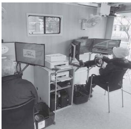
高齢者の交通安全講習

答 まずは、自主返納に対する交通安全教室での制度周知や市内における返納環境の整備、足となる地域公共交通の整備に加えて、定期利用する時の割引などで、今後もサポートをして参りたいと考えています。