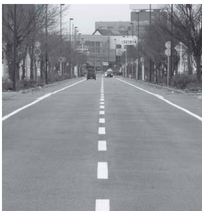
黄金学園通りと恵庭駅東口

答 ふるさと公園の再整備を契機として、事業者や町内会、大学、学生、パークPFIの事業者などが連携し、にぎわいづくりに主体的に取り組んでいくことが重要と考えており、今後はこれら取り組みに対し積極的に支援して参りたいと考えています。