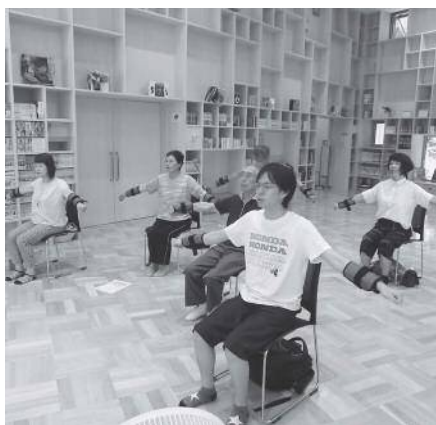
「いきいき百歳体操」サポーター養成講座

答 スポーツフェスティバルや老人クラブ連合会でも総合体育館を利用して測定の機会を設けていますが、今後も自分の体力測定数値を意識づけてできるよう、内容について協議していきたいと考えております。