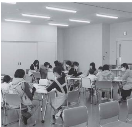
3歳児検診（保健センター）

答 保護者が3歳以降にも気づける機会が増えることは、早期発見・支援の理念に沿うものと思われま