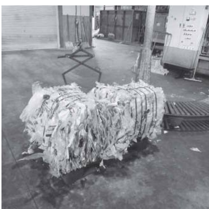
分別梱包されたプラスチック製ごみ

答 当面は現状の再利用及び再生利用による資源化を優先したいと考えていますが、情勢に応じて効果的かつ効果的な処理方法について、今後検討して参りたいと思います。