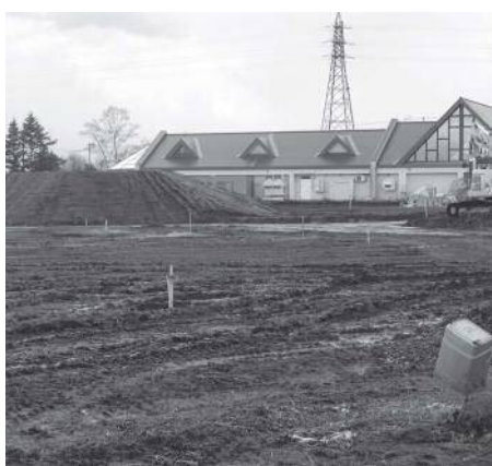
緑化フェアの会場となる「花の拠点施設」

今後は、北海道或いは近隣の市町村や庭園管理者とも連携しながら、進めて参りたいと思っております。