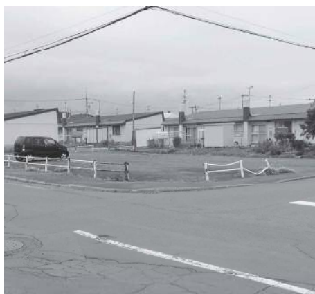
現在の市営住宅（柏陽団地）

答 先ずは、入居者の方を最優先し、安心安定した住居を提供することを視点にご指摘を受け止め、できるだけ早い機会に入居者の方が安心して、先が見える形を提示したいと考えていますので、今しばらく時間をいただきたいと思えます。