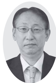
公明党議員団 野 沢 宏 紀 議員