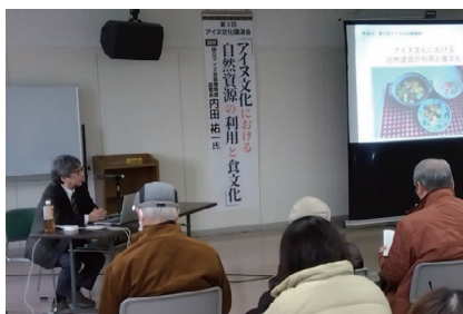
▲内田様による講演