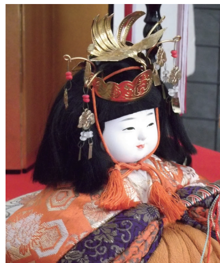
▲昭和30年代のひな人形

3月3日のひなまつりを前にこれまで寄贈をうけましたひな人形 9 組を展示します。古くは明治時代から平成2年制作のものまで素材、衣装、お顔立ちなど時代を追ってご覧ください。