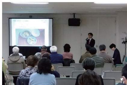
▲館長による開会の挨拶

さて、アイヌ文化講演会事業は来年度からお休みとなりますが、皆さんもっと知りたい、不思議だなと思う事があればいつでも郷土資料館へおこしてください。