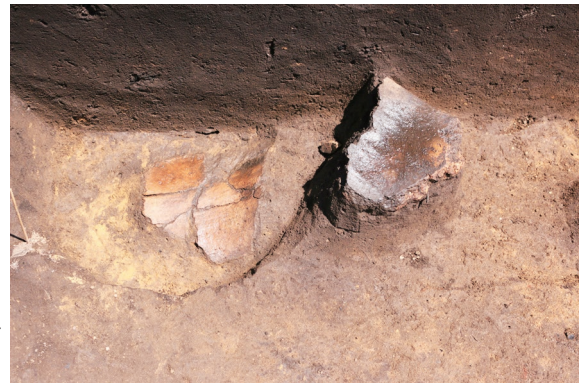
縄文土器の▶出土状況