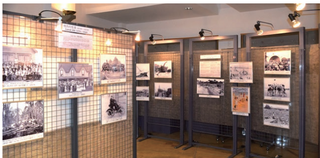
▲過去の展示の様子

姉妹都市ニュージーランド・ティマル市の歴史に関する写真展です。マオリの人たち、イギリスからの移民、街並みの移り変わりなど約30枚の写真パネルでご紹介します。