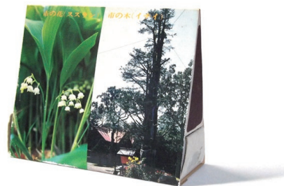
▲市制施行記念のマッチ箱