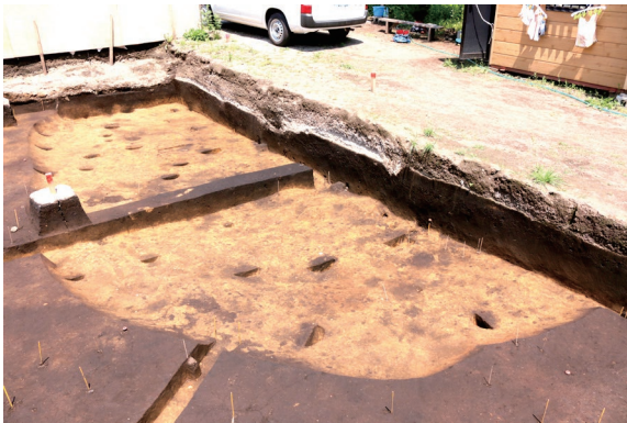
◀縄文時代の竪穴住居跡

出土しました。今後秋から冬にかけて土器や石器などを洗浄し、整理作業を進める予定です。