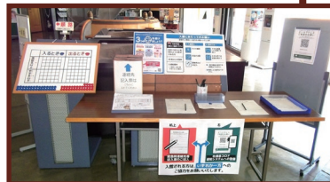
▲資料館入り口の様子