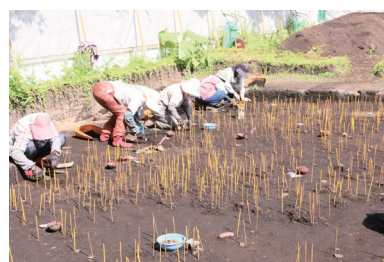
▲ユカンボシE1遺跡 発掘調査風景

4月20日(土)には、「カリンバ土曜講座」でユカンボシ川流域の遺跡を中心に発掘調査成果の解説を行います。