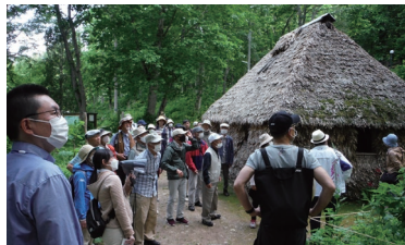
▲令和5年度アイヌ文化学習見学会