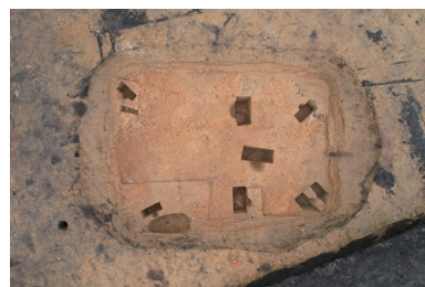
▲柏木川9遺跡 竪穴建物跡