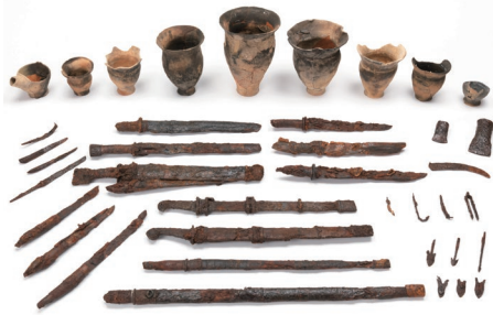
▲出土品の集合写真

これらの出土品は平成12年度に柏木川河川改修工事に先立ち行われた発掘調査により発見さ