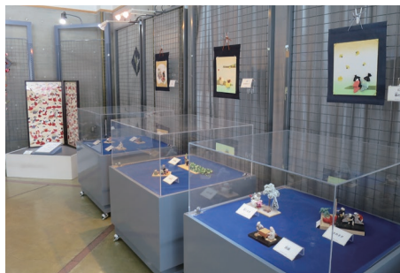
▲緋世創作人形展の様子

「あそび」や「家の手伝い」など日常生活の中に見られる「家族」「友達」の絆をテーマとして昭和の風景を題材に丹精込めて作られたちりめん細工の人形約30点を展示しました。豆まきや川遊