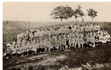
▲陸軍特別大演習清掃奉仕