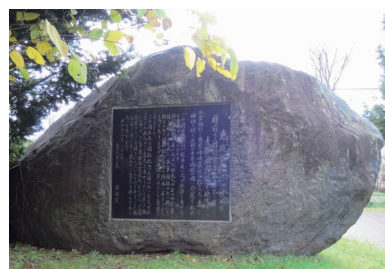
▲開拓記念公園石碑

郷土資料館では今年で12年目となる「カリンバ土曜講座」を下記のとおり行います。講師は当館の学芸員で、会場は郷土資料館1階研修室、時間は毎回10時から11時半までです。対象は小学4年生以上で、定員は先着35名、事前申し込み(37-1288)が必要です。皆様のご参加をお待ちしております。