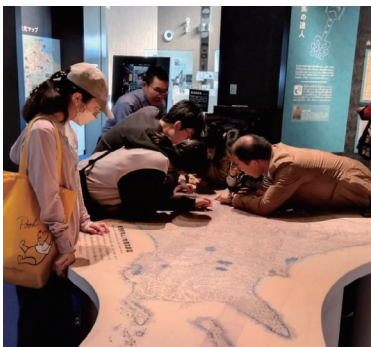
▲令和5年度アイヌ文化マスター育成事業