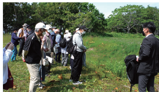
▲令和4年度のアイヌ文化学習見学会の様子

のコタンなどに行く計画です。日程等詳細は、決まり次第市のホームページや広報などに掲載します。