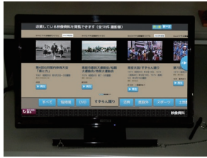
◀入口近くの閲覧用PC

館内入口すぐに設置している閲覧パソコン内の「映像資料」に7つの映像が加わりました。いずれも8mmフィルムをデジタル化したもので、一部は一昨年