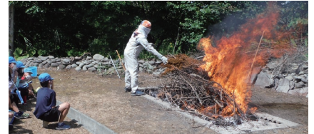
▲土器野焼きの様子

今回の野焼きは、割れてしまった土器も少なく子供たちに無事土器を渡すことができ良かったです。また、生徒の皆さんから感想文をいただきました。「楽しかった」「もっと知りたい」といった前向きな感想が多く、非常に嬉しい限りです。