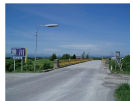
撤去された南12号漁川橋

南12号漁川橋は、昭和43(1968)年、漁太・林田地区の漁川の最も下流に架けられた橋でした。令和2年、漁川の堤防工事に伴い、新しい橋が架けられたため、本年4月に撤去されました。古来、恵庭の玄関口として栄えた同地区で人々の往来を50年以上支えた橋の銘板をこのたび資料としてご寄贈いただき、郷土資料館で保存させていただくこととなりました。