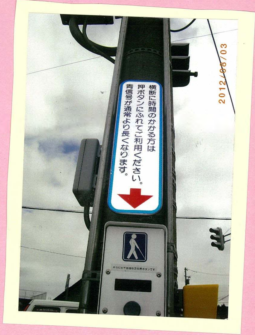
福住町2丁目セーコマート横の 横たん歩道