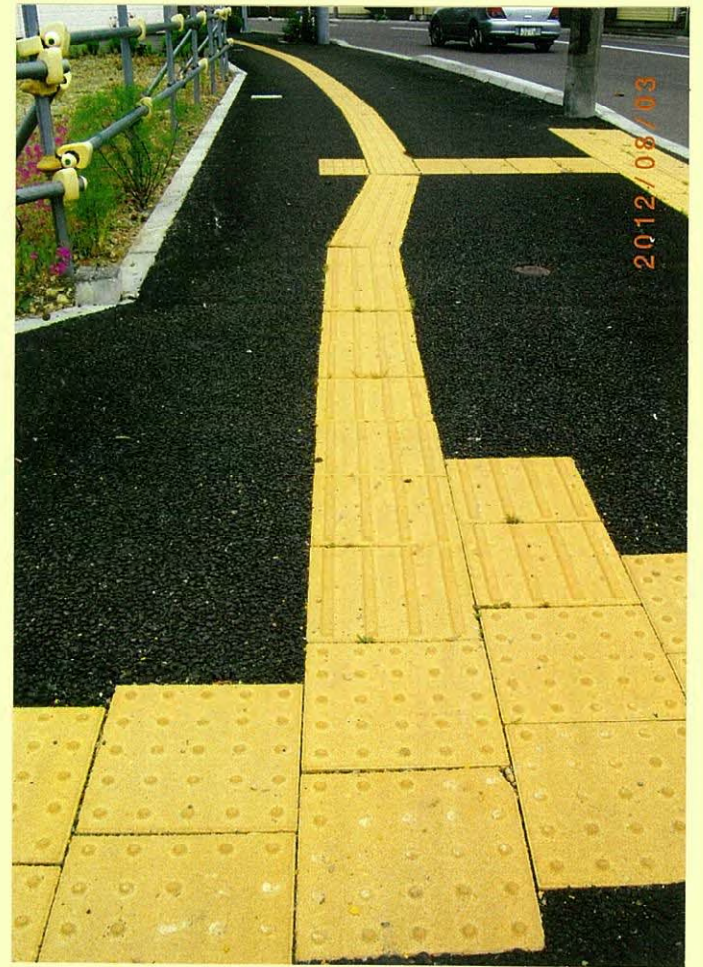
福住町2丁目セーコマート前