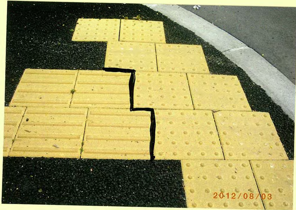
左が線状ブロック、右が点状ブロック