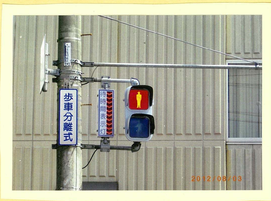
トヨーカドー前のしんごう