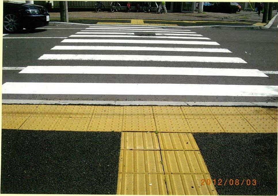
イトーヨーカドー前(上)