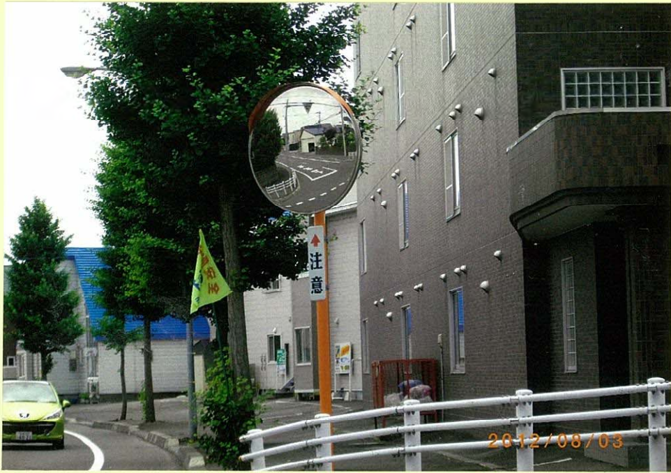
中島町5丁目交差点