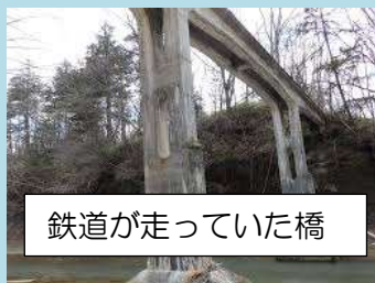
鉄道が走っていた橋