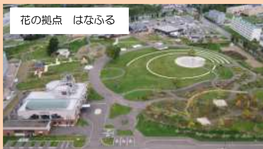
花の拠点 はなふる