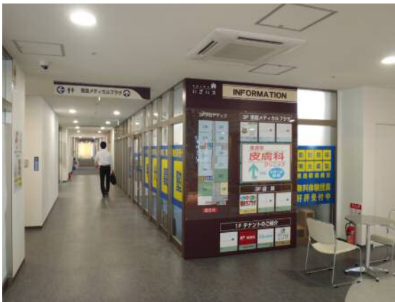
恵庭メディカルプラザ(いざりえ3階)