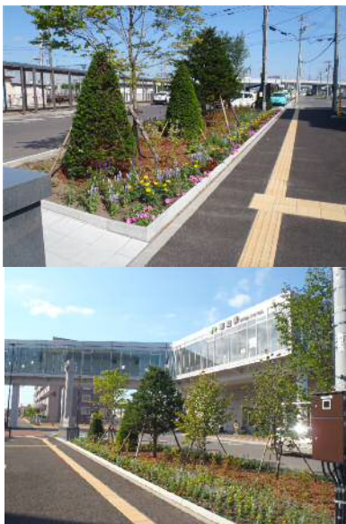
恵庭駅西口駅前広場 緑地帯完成写真

昨年度に引き続き、恵庭駅西口駅前広場緑地帯にツツジやアジサイを含み低木や、シバザクラやラベンダーを含み宿根草を植栽しました。今回植栽した低木や宿根草はまだ小さいですが、今後成長に合わせて2・3年もの見応えのあるものになっていき、マナーゴールドやペチュニア等の単年草も含めて色とりどりの花を咲かせ、みなさまの目を楽しませてくれる予定となっております。