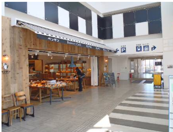
ベーカリー(いざりえ1階)