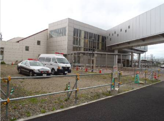
恵庭駅西口 移動交番

駅周辺では乗降客を狙った痴漢や強制わいせつなどの被害が起きているため、同管内で初めて移動交番を設けることになりました。移動交番はワゴン型の警察車両で、駅前広場の横に6月15日から設置しております。