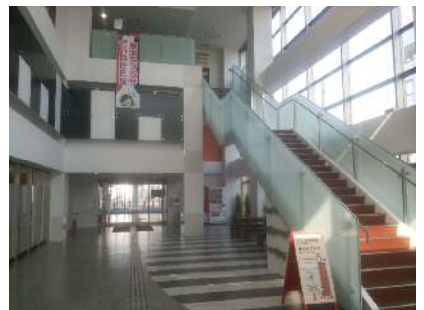
プロムナード（いざりえ1～3F）