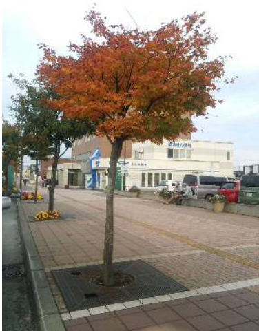
※参考 紅葉を迎えたヤマモミジ(恵庭東口駅前線)

また、駅前広場の緑地帯にはシンボルツリーを中心とした植栽を検討しています。今後も相生自治会の皆様と共に良い「恵庭の顔づくり」を進めてまいりますので、ご協力の程、よろしくお願い致します。