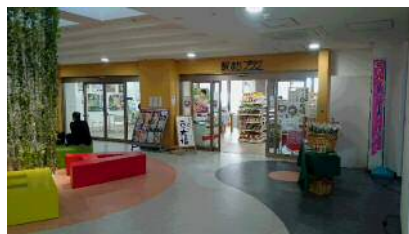
駅まちプラザ（いざりえ3F）