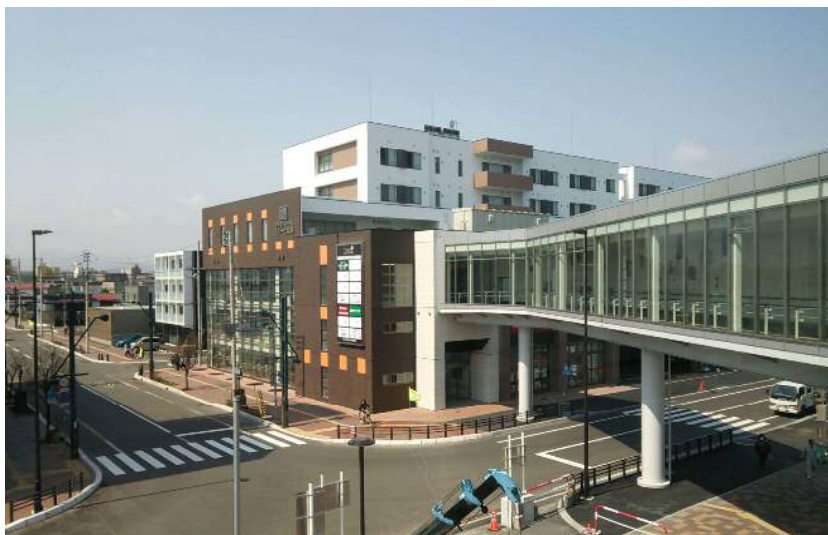
空中歩廊といざりえ