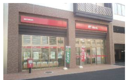
恵庭駅前郵便局（いざりえ1F）