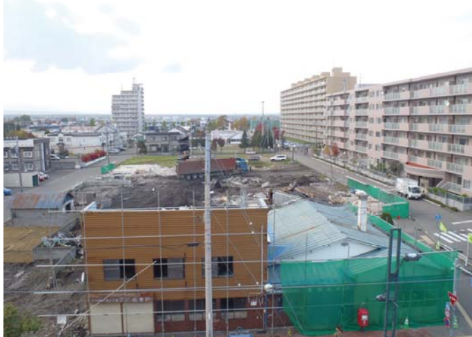
平成25年10月23日恵庭市撮影