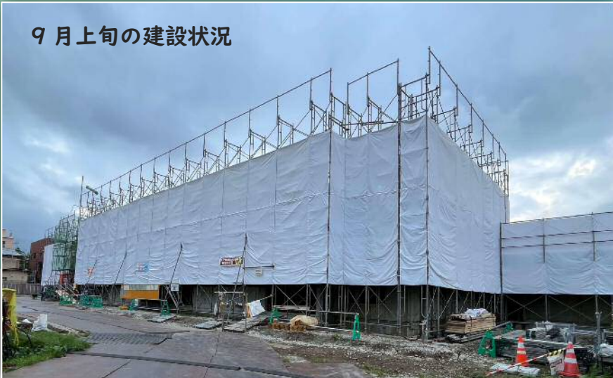
9月上旬の建設状況

恵庭市 建設部 市営住宅課 所在:市役所第2庁舎3階 電話:0123-33-3131