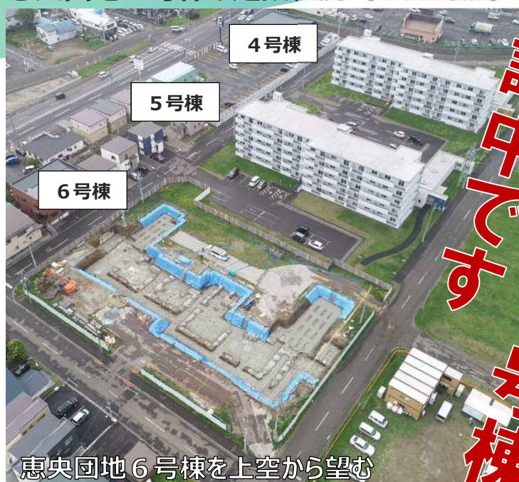
恵央団地6号棟を上空から望む

本年3月下旬から仮設工事をはじめ、4月から5月にかけて、杭工事及び堀削工事を行いました。