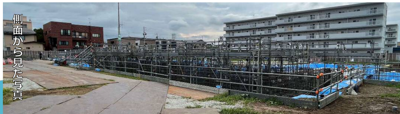
側面から見た写真