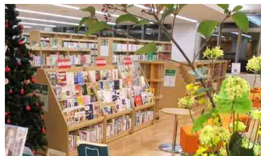
<フラワーライブラリーイメージ>