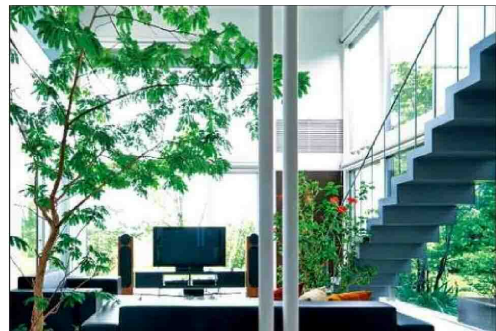
<センターハウスイメージ>

恵庭市保健センターは、「道と川の駅」及び当該計画地と隣接しており、敷地内には約100台収容可能な駐車場や芝生広場を有するなど、エリア全体の中で重要な配置となっている。今後、恵庭駅前への機能移転が予定されていることから、その建物を改修し、センターハウスとして有効活用する。