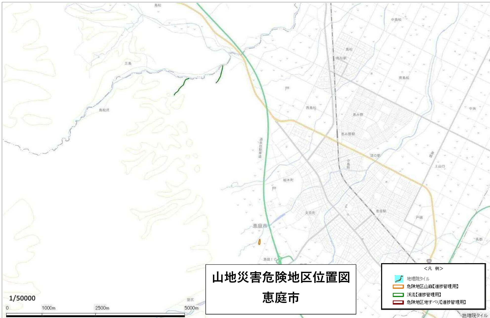
山地災害危険地区位置図 恵庭市