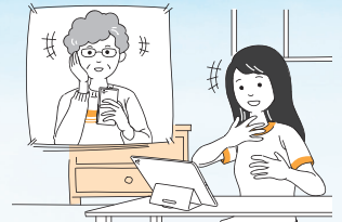
●家族や友人との会話