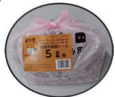
<貼り付けイメージ>