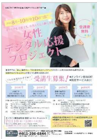
▲令和7年度実施ポスター

本事業は、令和8年度も実施を予定しています。興味のある方はぜひ、恵庭市ホームページなどをご確認の上、お申し込みください。