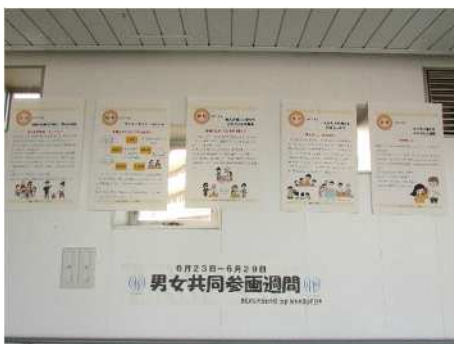
▲男女共同参画週間 (6/23~6/29)

恵庭市では男女共同参画の推進に係る啓発活動の一環として、男女共同参画の実現に向けた機運の醸成を図るため、国が定める「男女共同参画週間(6/23~6/29)」、「女性に対する暴力をなくす運動(11/12~11/25)」にあわせてパネル展を実施しています。期間中は、恵庭駅西口の空中歩廊に掲示しています。令和8年度も同様の期間にパネル展を開催する予定ですので、お立ち寄りの際はぜひご覧ください。