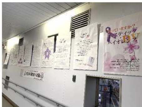
▼女性に対する暴力をなくす運動 (11/12~11/25)