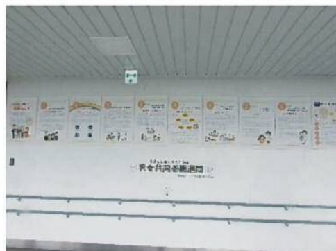
男女共同参画週間 (6/23~6/29)

国が定める「男女共同参画週間」、「女性に対する暴力をなくす運動」の期間、男女共同参画社会の実現に向けた機運の醸成を図るため、恵庭駅西口の空中歩廊にてパネル展を実施しています。