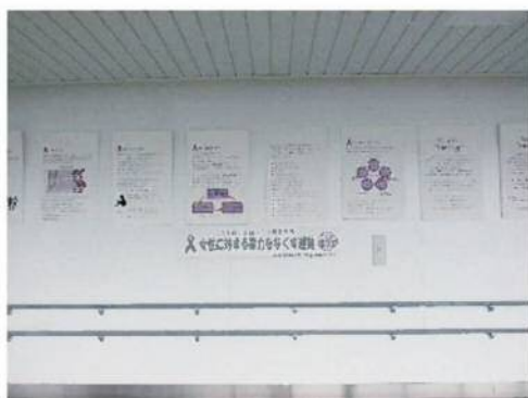
女性に対する暴力をなくす運動 (11/12~11/25)