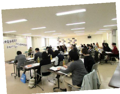
▲大会参加者の報告にみなさん興味深そうに耳を傾けていました。

「日本女性会議2017とまこまい」に参加した恵庭市内の女性団体の会員の方たちが大会報告会を開催しました。