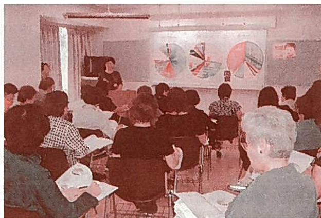
独立法人女性教育会館でのワークショップ