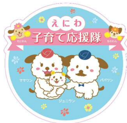
えにわ子育て応援隊協賛店舗の目印となるステッカー