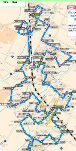
JR島松駅～JR恵庭駅西口～JR島松駅 54系統