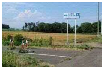
札幌恵庭自転車道

・市内の自転車ネットワークを構成する自転車マップの作成は、令和3年度より着手する。