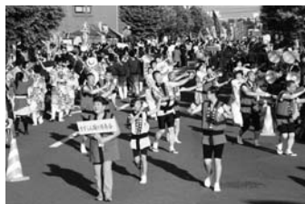
8/5 しままつ鳴子まつり