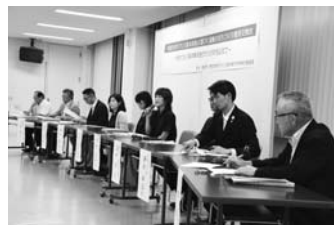
8/16 恵庭市まちづくり基本条例協働のまちづくり意見交換会