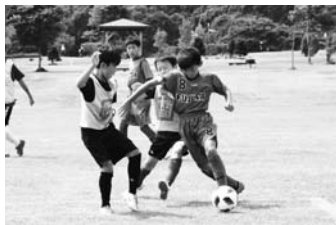
7/28 第3回恵庭市長杯少年少女サッカー大会