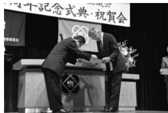
7/28 民生委員児童委員連絡協議会創立70周年記念式典