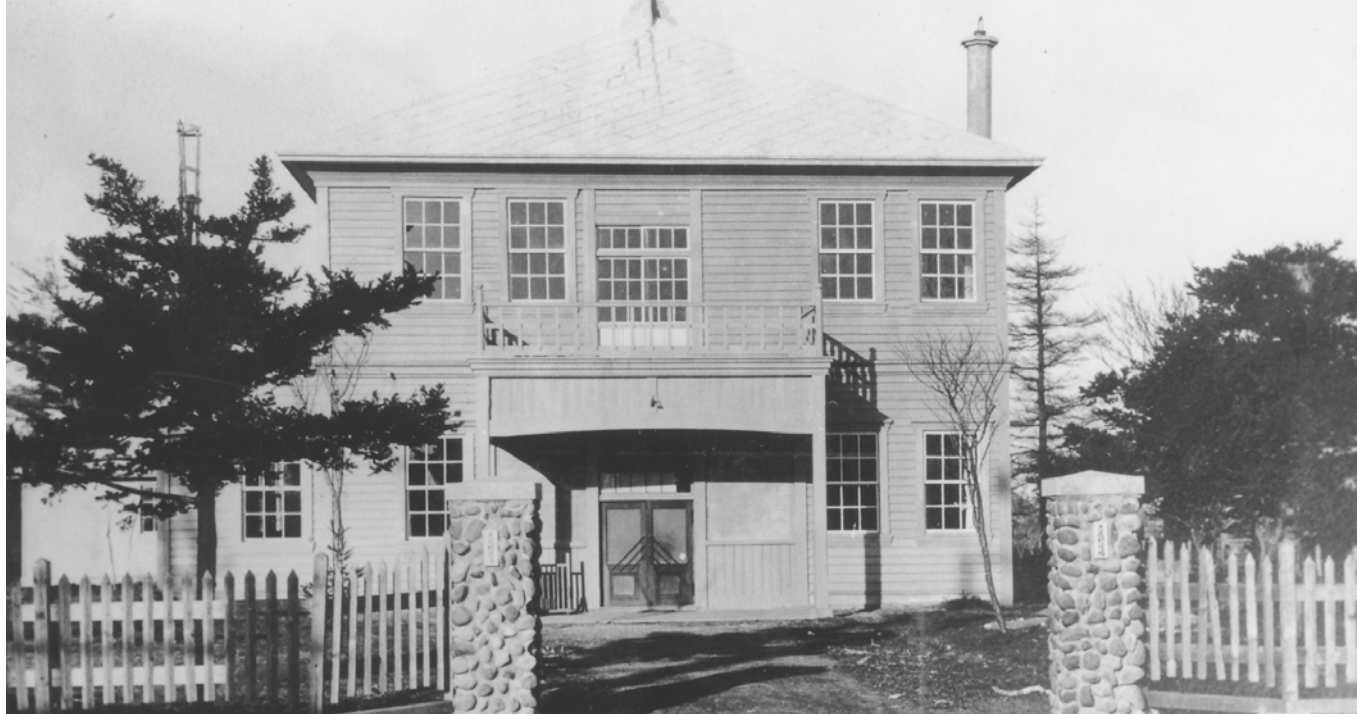
▲大正15年9月に完成した2階建ての役場庁舎。11月5日に庁舎移庁式が行われた