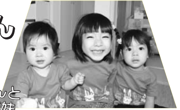
お姉ちゃんと仲良し3姉妹