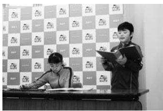
3/6 若草小6年生「発信！未来プロジェクト」発表