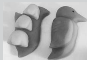
Cafe & IT Fiesta

藤枝市の抹茶と恵庭市のカボチャ・サツマイモを使った練り切りの上生菓子。恵庭市の鳥・花であるカワセミ・スズランをモチーフにしています。