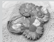
ICHIE Flower & Sweets

藤枝市の抹茶をふんだんに混ぜ込んだ、濃厚ショコラのぜいたくな味わい。風味豊かなクッキー生地と組み合わせ、花のまち恵庭市をイメージしたかわいいお花型のショコラサブレ。