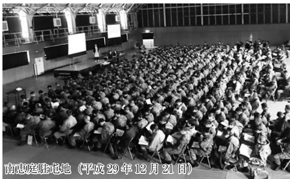
南恵庭駐屯地 (平成29年12月21日)

特別なことをする人ではありません。認知症について正しく理解し、認知症の人やその家族を温かく見守る応援者として、自分のできる範囲で活動します。学んだ知識を友人や家族に伝えることや、認知症の人やその家族の気持ちを理解しようと努めること、道に迷っている様子を見かけたら「お手伝いすることはありますか?」と声をかけてみるのもサポーターの活動です。