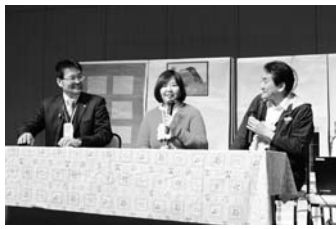
3/16 成年後見支援センター講演会