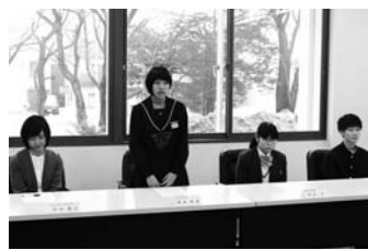
3/9 青少年国際交流派遣事業出発報告