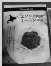
スウィートグラス

藤枝産自然薯パウダーと北海道産エゾシカ肉を使った、まろやかでコクのあるミートソースです。美味しい鹿肉をご自宅でも堪能でき、自然薯パウダー単体でも、他の料理と組み合わせるとさまざまな味わいを楽しめます。