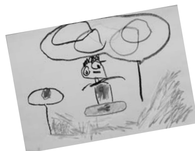
すみれ保育園児作品