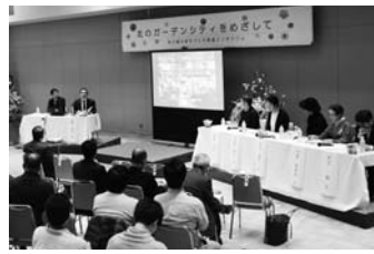
3/17 花と緑のまちづくり推進シンポジウム