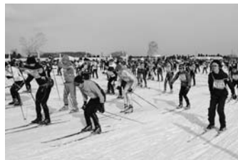
2/19 第29回恵庭クロスカントリースキー大会