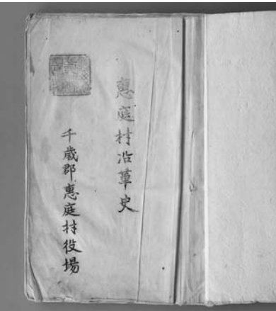
▲『恵庭村沿革史』。左上に「北海道千歳郡恵庭村役場」の押印がある

『恵庭村沿革史』は恵庭村役場が作成した、現存する最も古い歴史編さん物である。内容は「開村の由来」にはじまり、「地理」「気候」「教育」など8項目にわたる沿革と、各種の統計表から成っている。毛筆で書かれたものを石版刷りにし、関係各機関に配布されたといわれるこの資料は、今のところ企画・広報課が所蔵する1点のみしか見つかった