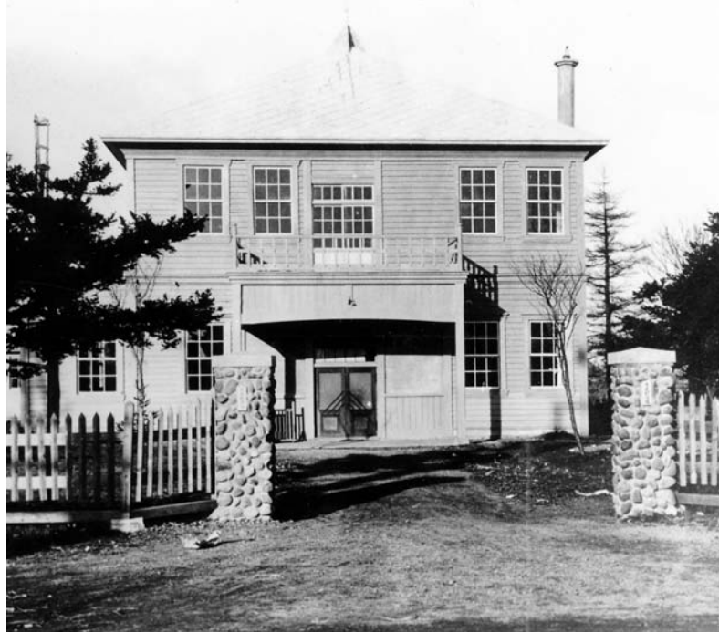
▲中恵庭で大正15(1926)年に改築落成した恵庭村役場庁舎