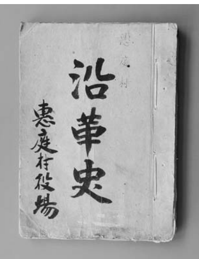
▲『恵庭村沿革史』の上に新たに付けられた「沿革史」の表紙

ていない(上写真)。刊行年は明記されていないが、開村から大正二(一九一三)年三月三十一日、つまり大正元年度までを扱っていることから、市史(昭54刊)編さん事務局では大正二年の編さんと見ていたようだ。統計表については、扱っている年代の終わりが一様ではない。たとえば、村費の歳入歳出のようにデータをまとめるのに一定の期間を要する項目は明治四四(一九一一)年まで、片や官公署の数のように直近の数値を入れることが可能な項目は大正二年までと、まちまちである。米、麦、小豆など産物の収量が元年で終わっているところを見ると、やはり二年の編さんで見ると妥当だろうか。 先に、石版刷りされたこの資料は1点しか見つかっていないと述べたが、実はこれには