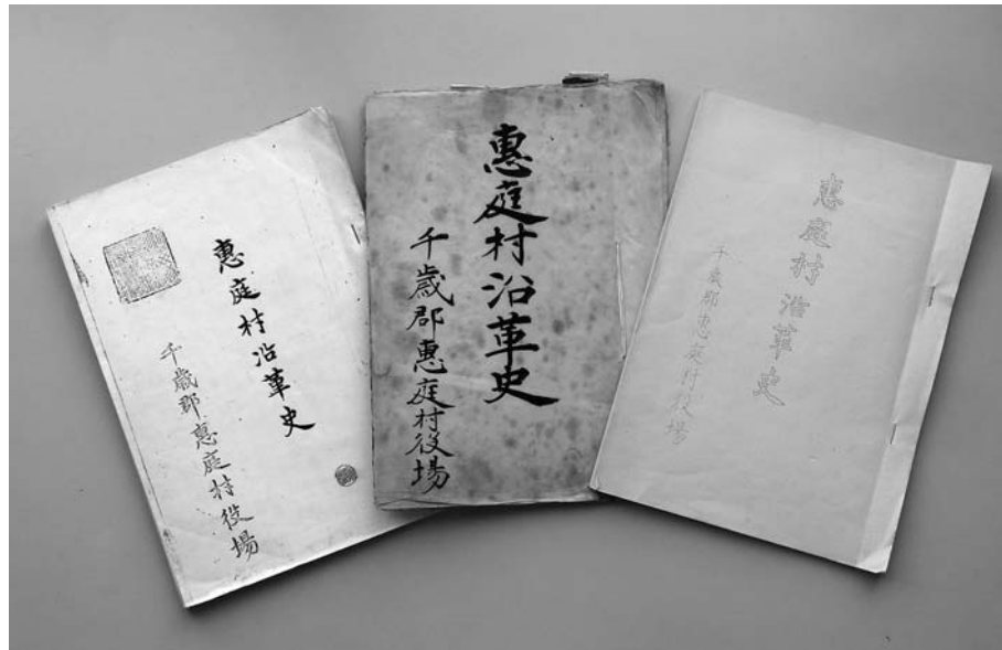
▲「恵庭村沿革史」の複製。左から、複製A、B、C

この写しのおかげで『恵庭村沿革史』の原形が明らかになった。そればかりか、綴じ直した際の落丁であろうか、原本には統計表の最後に掲載されていたはずの「病院医師薬剤師産婆表」が抜け落ちていることまで判明した。