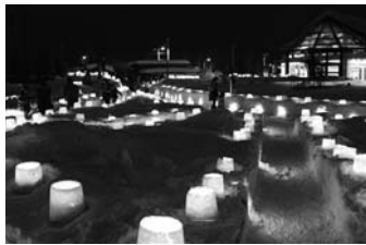
2/4 えにわシーニックナイト 2017