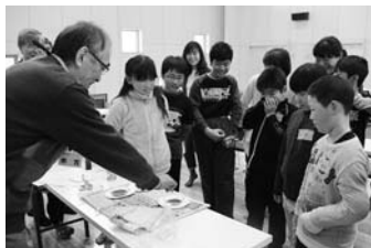
2/12 夢科学☆えにわネット 科学の祭典パートII