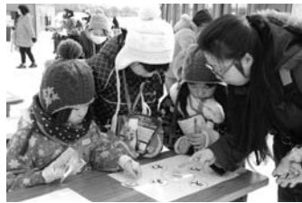
2/11 第34回 えにわ雪んこまつり