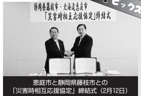
恵庭市と静岡県藤枝市との「災害時相互応援協定」締結式 (2月12日)

午後開催▼幼児・小学校低学年各回30人 問合せ先 図書館本館(☎37・2181)