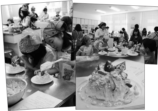
親子ふれあい教室・ひなまつりケーキ作り

ひなまつりは女の子の成長を祈る節句の行事。代表的なお菓子といえば、ひなあられやひし餅を想像する人が多いですが、今やひなまつりの定番お菓子といえば、みんなが大好きなケーキ。伝統的なお供え物もさることながら、ひなまつり用にデコレーションされたケーキを楽しみにしている子どもも少なくありません。お母さんと一緒に作ったケーキなら、もっとおいしいね!