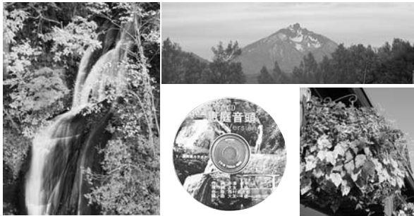
恵庭音頭 2014バージョン 全7番

1. ハア 天に鋭く とがった山は 街を見おろす 守り神 ヨイヨイ その名にのこる 恵庭の沃野 きょうも恵みの花が咲く ソレ 恵庭よいとこ ヨイヤサノサ ンヨイヤサノ コリヤサノサ ♪