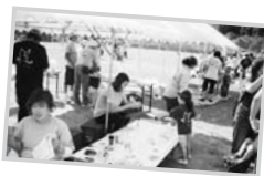
※昨年度の様子※ ▶開会式。人がたくさん！ ◀しゃぼん玉であそぶ子どもたち

なぜ「いけませ夏フェス」を開催するのか？ 根底にあるのは、「障がいの有無に関係なく、ともにまざり合い、助け合って生きていける場を、ここに暮らす人同士のつながりを、この恵庭市にもつくりたい」という思い。「障がいのある