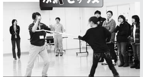
防犯訓練等研修会 さすまたの実践練習の様子(1月24日)

午後開催▼幼児・小学校低学年 各回30人 問合せ先 図書館本館(☎37・2181)