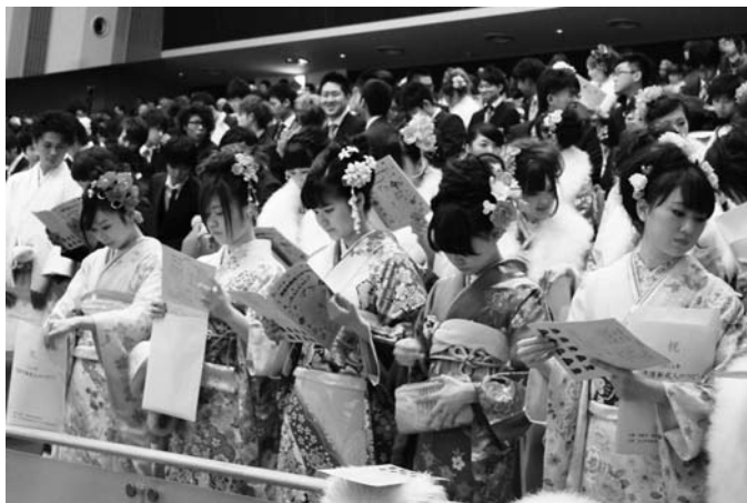
2014年恵庭市成人のつどい（市民会館大ホール）

色鮮やかな振り袖の女性たち、真新しいスーツや袴姿の男性たち…。今日は成人式、旧友との再会を喜びあいながら、大人への一歩を踏み出す記念の日。式典後には、今回初めて企画された「未来の樹」コーナーで、新成人たちがこれからの決意や抱負を書いた紙を、木の幹が描かれた壁に次々と貼りつけました。