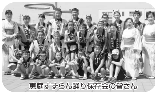
恵庭すずらん踊り保存会の皆さん