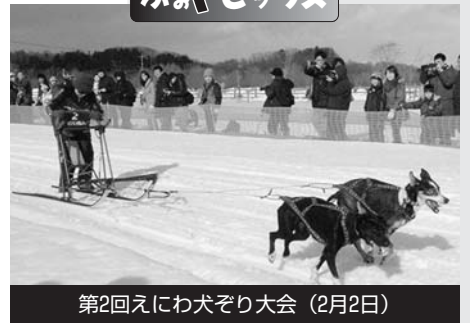
第2回えにわ犬ぞり大会 (2月2日)