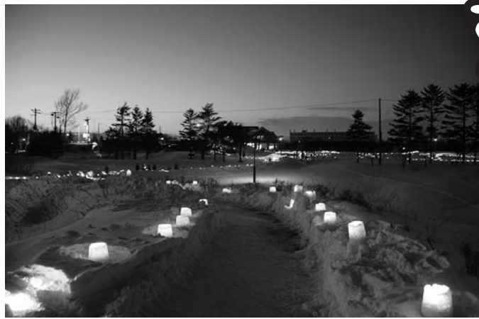
えにわシーニックナイト（花ロードえにわ会場）

恵庭の冬をやさしい光で包む「えにわシーニックナイト」が2月9日、市内17の会場で行われた。市民手作りのアイスキャンドルやスノーランタン約1万5千本がともされ、街中に幻想的な光景が広がった。この日は風も弱く穏やかな日和で、訪れた多くの人が美しい冬の夜を楽しんでいた。