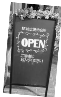
待合所は1月24日オープン

JR恵庭駅西口の駅前広場待合所で、2月8日から14日まで「プチ☆ギャラ」が開催された。市内外の手作り小物作家とえこりん村が協力して、かわいい小物作品を展示。待合所には、ぬいぐるみや布小物のほか、イラストやステンドグラスなどが並べられ、初日の8日と9日には無料で温かいコーヒードも振る舞われた。