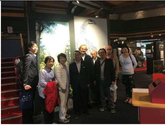
・アートギャラリー