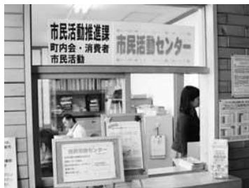
▲市民活動センター窓口