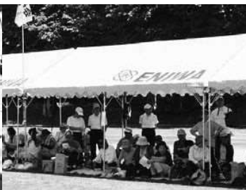
▲テントなど備品の貸し出し