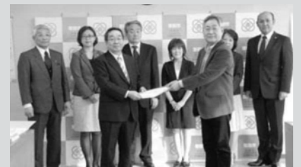
広報えにわ 2015年2月 2

市民活動センターの必要性や役割、機能、運営体制などの検討を行い、提言書にまとめ市長に提出。