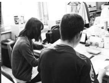
▲申請・相談の受け付け