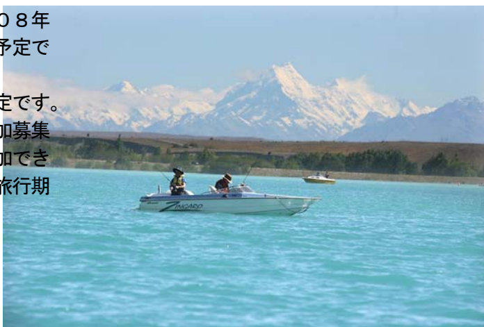
（湖の素晴らしい風景）

現在、締結応援ツアーとして市民に参加募集をしております。貴団体で、一緒に参加できる方は是非この機会にご応募願います（旅行期間は2月9日～15日です）。