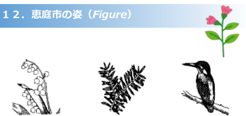
市の花「スズラン」 市の木「イチイ」 市の鳥「カワセミ」