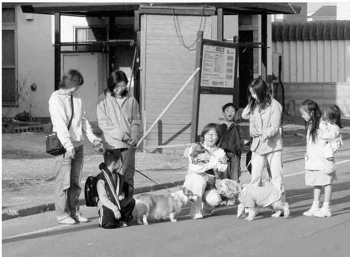
自主防犯活動(わんわんパトロール)