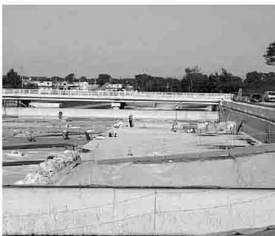
温水平池改修工事(茂漁川)

○ジェット戦闘機や重戦車重火砲の演習に起因する騒音や振動、演習場内の荒廃の緩和を図るため、障害防止・騒音防止・民生安定事業を推進し、市民生活の安定化に努めることが必要です。