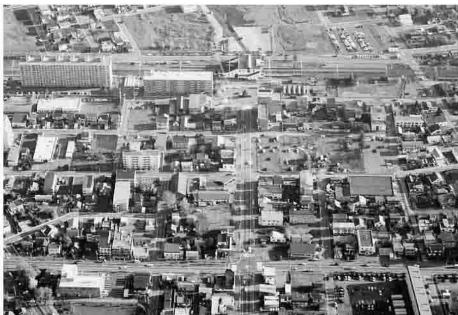
JR 恵庭駅西口周辺(平成13年10月30日撮影)