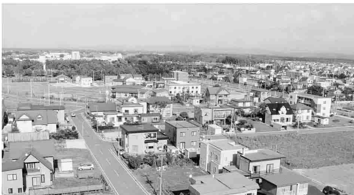
西金エコータウン