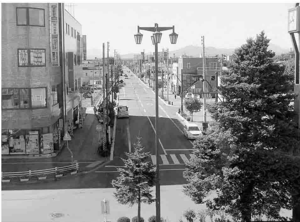
JR恵庭駅から西口方面