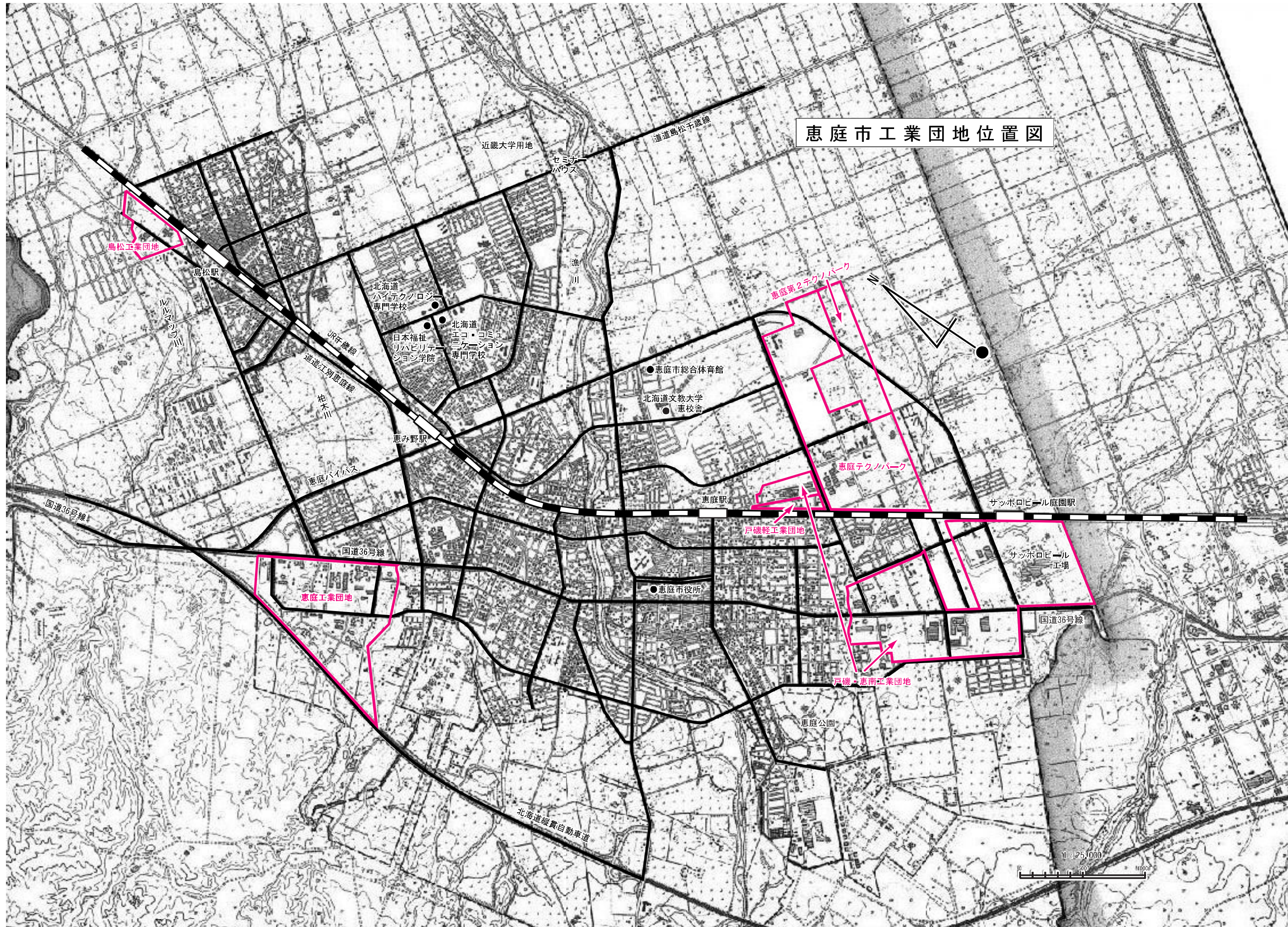
恵庭市工業団地位置図