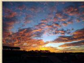
第18位 おけましておめでとうございます 2021.1.4